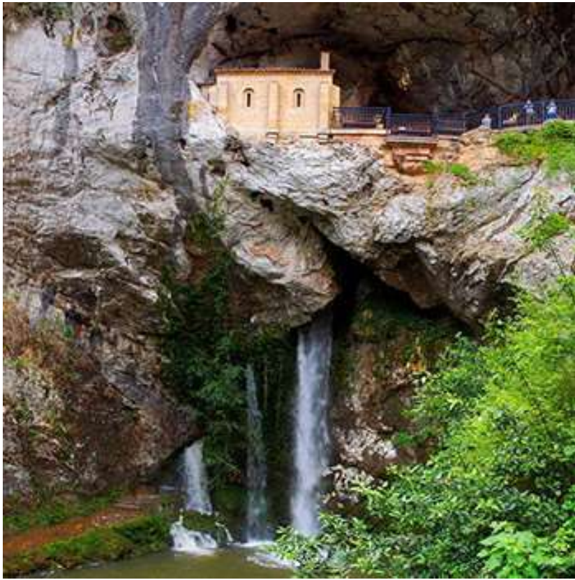
Cueva de Covadonga.

hombres, se atrincheraron en Cova Dominica. Utilizaron arcos y piedras. Los musulmanes, poco más numerosos, retrocedieron, pero fueron derrotados.