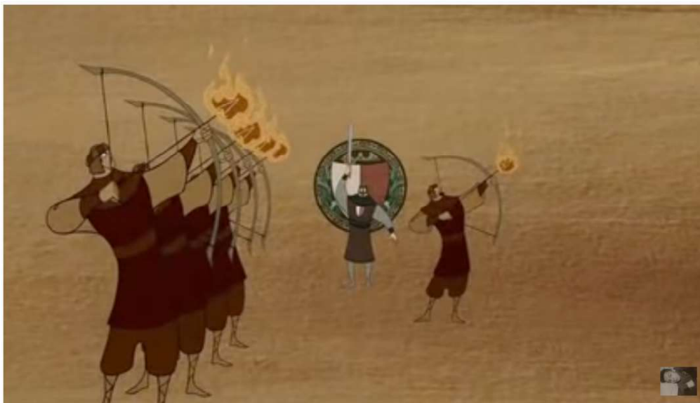
EL CID LA LEYENDA PELÍCULA COMPLETA EN ESPAÑOL

Amplía tus conocimientos. Mira la película El Cid, disponible en el Ambiente Virtual de Aprendizaje.