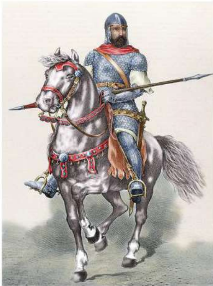
Rodrigo Díaz de Vivar. Disponible en: shorturl.at/tuQ23

Rodrigo de Vivar nació en Burgos en 1043. Participó de diversas campañas y demostró mucha destreza en combate. Rodrigo pasó a ser conocido como el Cid Campeador. Cid (Cidi) significaba mi señor y campeador, guerrero invicto. En las batallas contra Aragón para el control de Zaragoza, Rodrigo Díaz de Vivar fue reconocido como el primer soldado del Rey. El Cid murió en su Castillo, en Valencia, en 1094. Sus restos mortales están en la Catedral de Burgos.