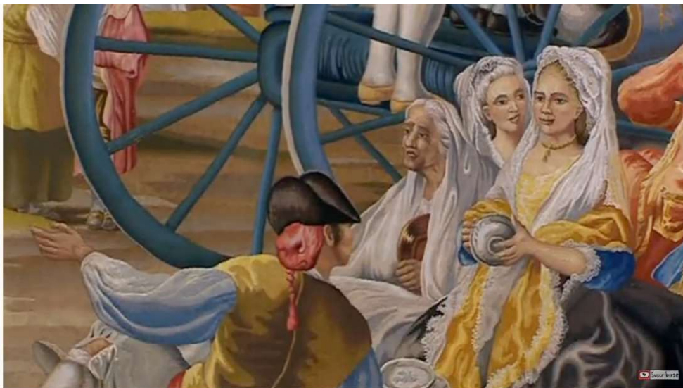
#goya #franciscodegoya #geniopintura

De los Austrias a los Borbones. Disponible en: shorturl.at/cijBE