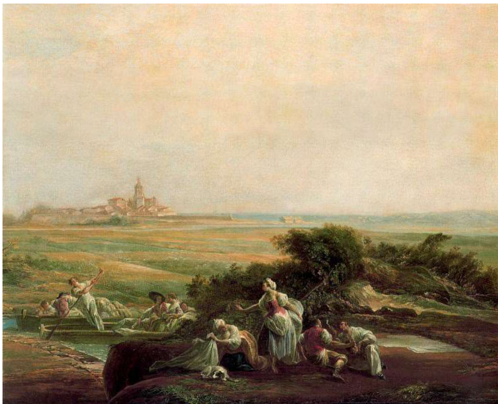
Vista de Fuentebarría, de Luis Paret y Alcázar. Disponible en: shorturl.at/itHQ2

En el arte (música, arquitectura, pintura y escultura) se desarrolló el rococó y el neoclasicismo. El rococó representaba la vida lujosa y opulenta de la realeza europea. En el rococó se valoraba una naturaleza delicada y suave. En la pintura, predominaron las luces y las curvas.