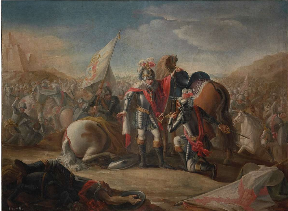
La Batalla de Aljubarrota, de Mariano Salvador Maella. Disponible en: shorturl.at/CGIN7