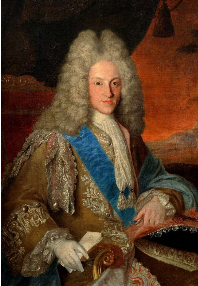
Felipe V. Disponible en: shorturl.at/CK169

Con el Tratado de Utrecht de 1713, Felipe de Borbón, Felipe V de España, renunció cualquier posible derecho a la corona francesa y los Países Bajos españoles y los territorios italianos de Nápoles y Cerdeña pasaron a Austria. Inglaterra pasó a tener el dominio de Gibraltar y Menorca y pasó a tener permiso para comerciar con esclavos en las Indias.