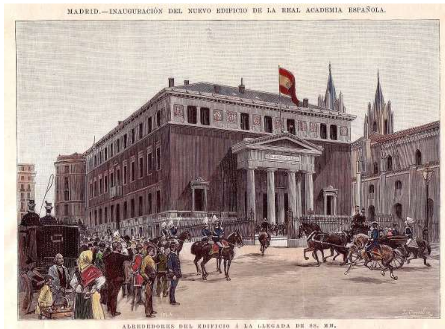
Inauguración del nuevo edificio de la RAE en 1894.

La Real Academia Española (RAE) fue fundada en Madrid el año 1713 por iniciativa de Juan Manuel Fernández Pacheco y Zúñiga, bajo el reinado de Felipe V. La institución fue influenciada por el modelo francés y tenía como propósito preservar la unidad y la pureza lingüística del español. Después del análisis de varias propuestas, los fundadores eligieron como lema de la RAE: limpia, fija y da esplendor.