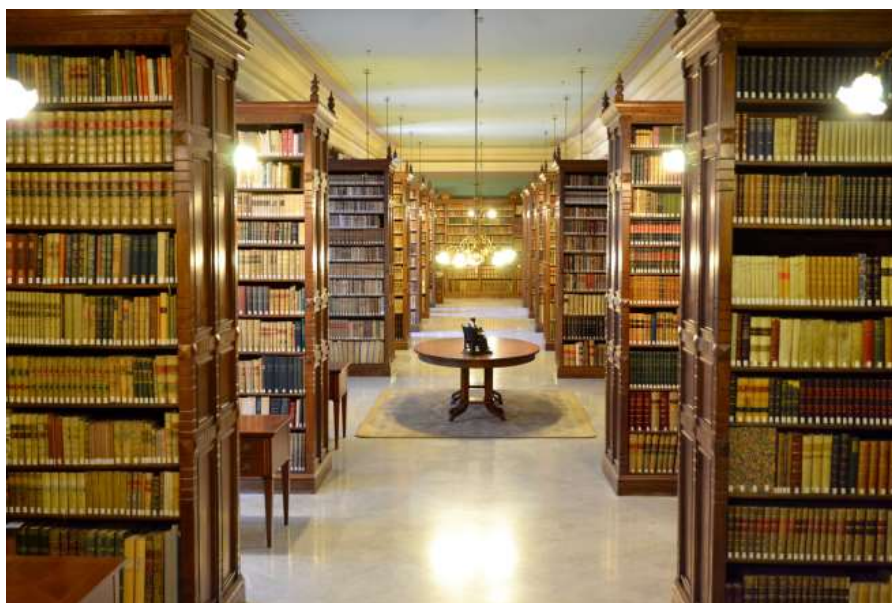
Biblioteca de la Real Academia. Disponible en: shorturl.at/dirT8