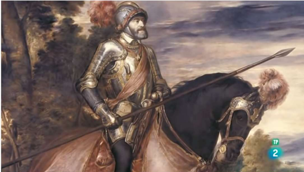
Tesoros de la Corona - De los Austrias a los Borbones

Amplía tus conocimientos. Mira los videos indicados en nuestro Ambiente Virtual de Aprendizaje.