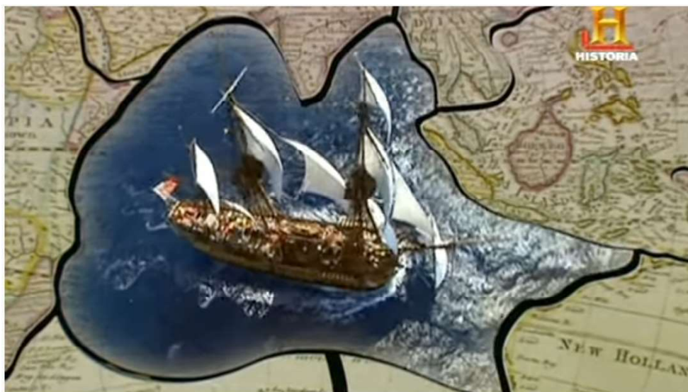
La Revolución Industrial (1/6) - El mundo material

Amplía tus conocimientos. Mira los videos disponibles en el Ambiente Virtual de Aprendizaje sobre la Revolución Industrial.