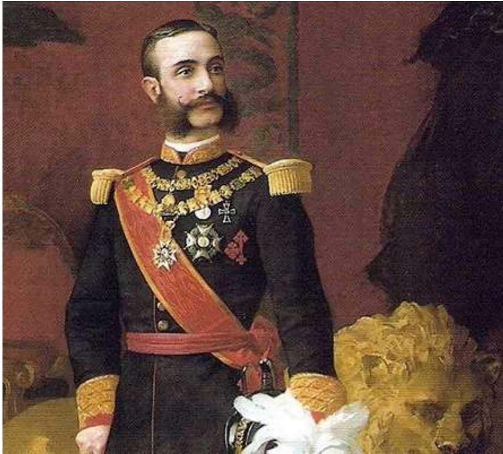
Alfonso XII.

Alfonso XII, el Rey Pacificador, también llamado rey soldado, liberal y romántico fue por apenas una década el jefe del estado español. Murió a los 27 años de edad, víctima de la tuberculosis.