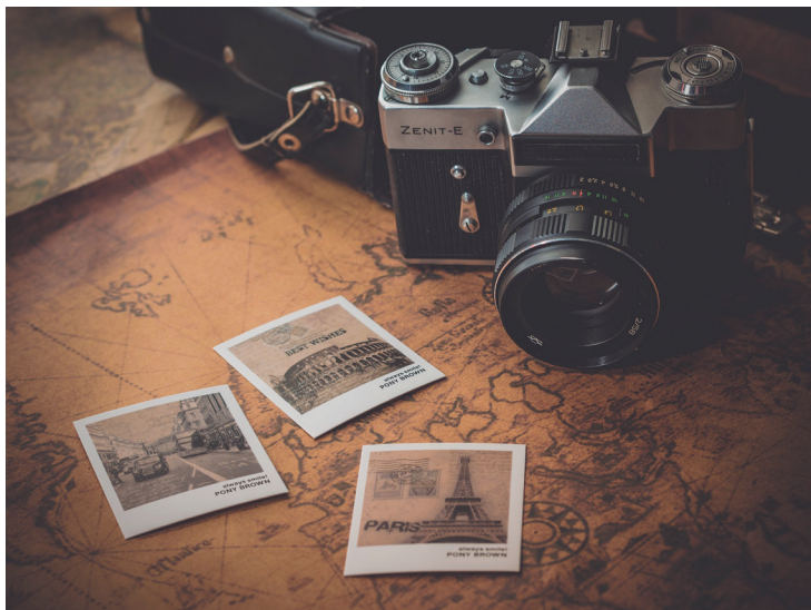
Figura 1 – Câmera fotográfica