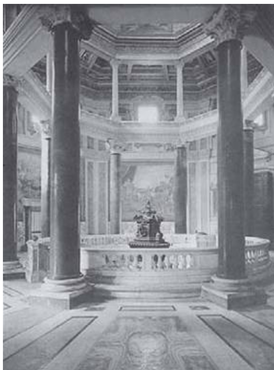
Batistério da Igreja de São João de Latrão, em Roma, datado da época do imperador Constantino.

Iniciaremos o presente capítulo revendo algumas questões relacionadas à crise do Império, com o propósito de acompanhar as transformações que se seguiram à ruína do mesmo, especialmente da sua parte ocidental. Com esse assunto iniciamos o estudo da chamada Alta Idade Média, período marcado primeiro pela regressão no que diz respeito à organização política e ao domínio cultural dos romanos, à qual se segue o aparecimento das condições para o crescimento que vai orientar a formação de um mundo novo.