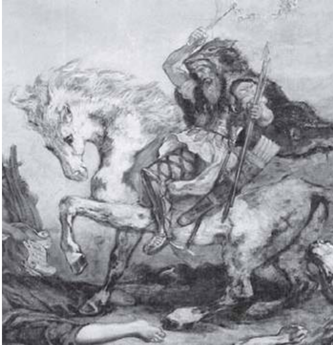
Átila, chefe dos hunos (434-453) (Fonte: Revista L' Histoire, n. 327, janeiro de 2008, p. 62).

Os hunos costumam ser conhecidos pelo seu rei Átila, chamado de o “flagelo dos deuses”. O depoimento abaixo sobre o aspecto e os costumes reforça a imagem de um povo rude e violento.