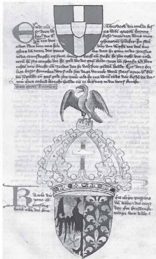
Brasão de Carlos Magno. Resembrace a digna imperial romana, que está em todas as brases imperiais, dos czares a Napoleão. A seu lado, as brases-de-lis do reino dos francos, que só terminará com a Revolução Francesa.