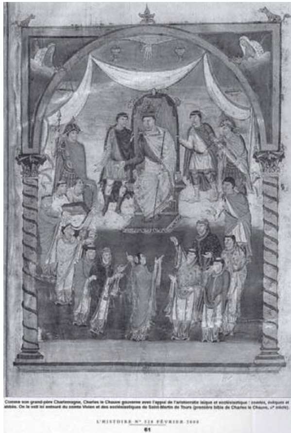
Ilustração alusiva ao apoio da aristocracia laica e eclesiástica ao governo de Charles de Chouve, filho de Carlos Magno.

O Império Carolíngio foi responsável “por um verdadeiro renascimento administrativo e cultural através dos limites do Ocidente continental. O sistema de cunhagem de moedas foi padronizado, e recuperado seu controle central. Em muito próxima coordenação com a Igreja, a monarquia carolíngia patrocinou uma renovação da literatura, filosofia, arte e educação. Missões religiosas eram enviadas às terras pagãs além do Império. A grande nova zona de fronteira da Germânia, ampliada pela sujeição das tribos saxônicas, pela primeira vez foi cuidadosamente atendida e sistematicamente convertida – um programa facilitado pela mudança da corte carolíngia mais para o leste, em Aachen, a meio caminho entre o Elba e o Loire. Além disto, uma rede administrativa elaborada e centralizada desceu sobre toda a massa, da Catalunha a Schleswig e da Normandia à Estíria. Sua unidade básica era o condado, derivado da velha civitatis romana. Nobres de confiança eram nomeados condes com poderes judiciais e militares para governar estas regiões, numa clara e firme delegação de autoridade pública, revogável pelo imperador. Havia uns 250 a 350 destes agentes pelo Império;