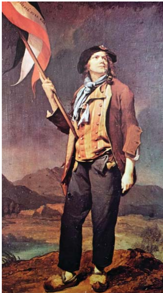
“O plebeu parisiense ( sans-culotte ) numa versão idealizada ( Grandes Personagens da História Universal , vol. IV, 1972, p. 820)

Em 14 de julho de 1789, manifestantes em armas realizavam a tomada da prisão política da Bastilha, fortaleza vista como símbolo do absolutismo, apesar de quase não ser mais utilizada em 1789. O episódio passou a ser chamado de Segunda Jornada Revolucionária . A importância desse acontecimento reside no fato de que, a partir desse momento, o movimento contaria também com a presença das massas trabalhadoras. Data oficialmente desse dia o início da Revolução Francesa”. (Costa e Mello, 2008, p. 331).