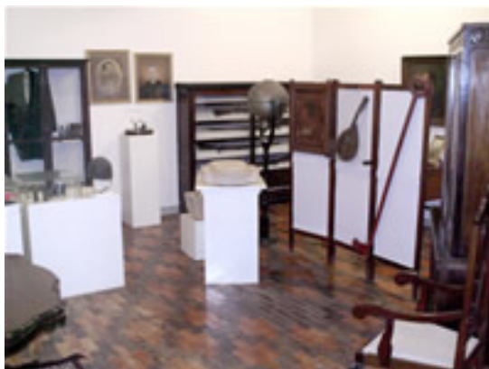
Museu Galdino Gutman Bicho (IHGSE)

Já o museu Galdino Gutman Bicho , localizado no IHGSE, tem uma diversidade de peças que se referem à história local, nacional e mundial, sendo composto por indumentária, mobiliário, moedas, medalhas, armas, utensílios domésticos, esculturas, pinturas, fotografias, maquinaria, objetos arqueológicos, objetos paleontológicos e outros.