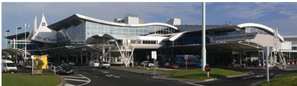
Figura: Terminal internacional do Aeroporto de Auckland.

O turismo doméstico também é importante, sendo que as despesas desse tipo de atividade chegam a US$ 13 bilhões e superam as despesas de turistas internacionais, de US$ 9 bilhões em 2010. No geral, o turismo mantém cerca de 180.000 empregos em tempo integral (10% da força de trabalho na Nova Zelândia).