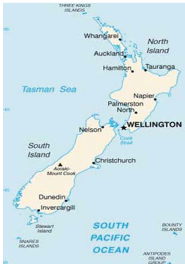
Figura: Mapa da Nova Zelândia.

é mais evidente nos Alpes do Sul, formados pela compressão da crosta ao lado da falha alpina. Em outros lugares do limite da placa envolve a subducção de uma placa sob a outra, produzindo o fossa de Puysegur o sul, a fossa de Hikurangi ao leste da Ilha do Norte e as fossas de Kermadec e de Tonga mais ao norte.