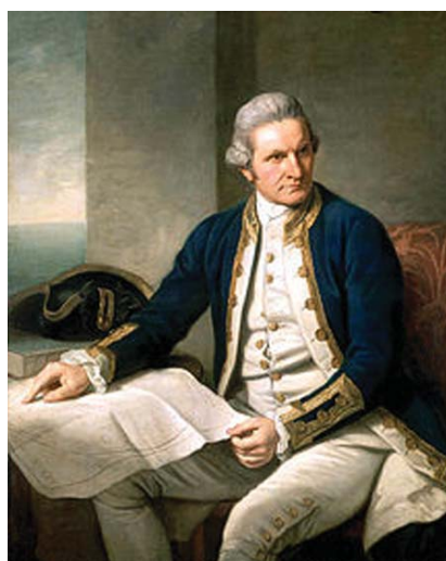
Retrato do comandante James Cook, por Nathaniel Dance (1775).

Os britânicos incorporaram a Austrália aos seus domínios em 1770. No ano da incorporação oficial, habitaram a ilha-continente cerca de 300 mil nativos, divididos em mais de 600 tribos, que falavam mais de 500 dialetos.