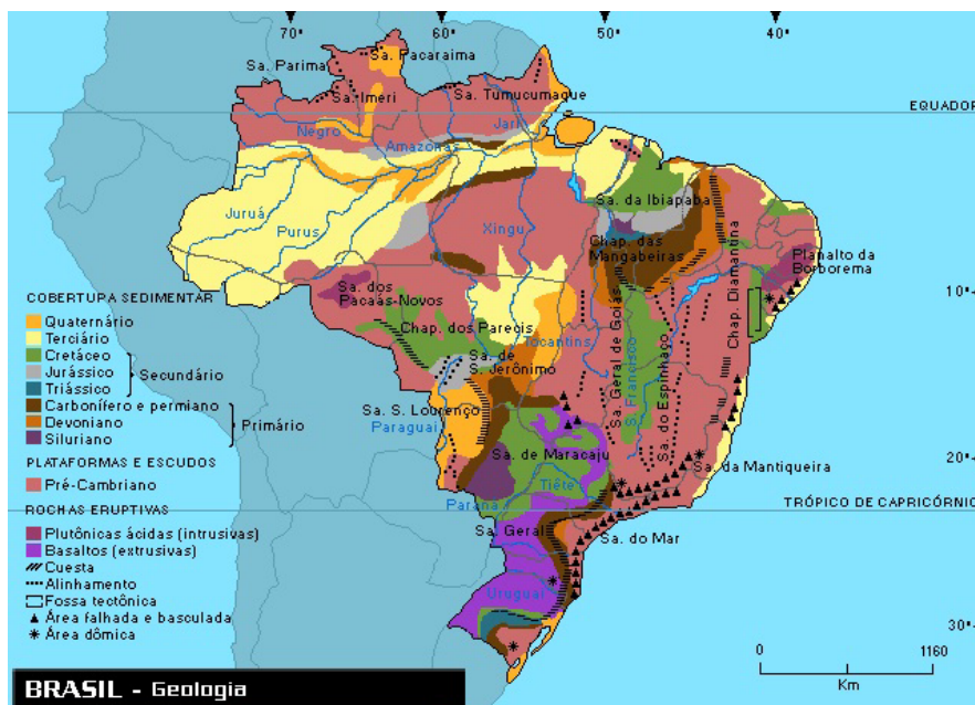
Figura 1.2 – Exemplo de um mapa representando um fenômeno geográfico físico (Geologia).

Daqui para diante consideraremos a Cartografia Temática como a linguagem de representação de fatos e fenômenos geográficos com especificidades que resultam no processo de tradução visual de uma informação geográfica compatível com o significado intrínseco da informação a ser traduzida. Além de representar diferentes fenômenos geográficos de, a exemplo dos tipos de solos e rochas, por exemplo, a Cartografia Temática expressa também idéias abstratas como áreas de influ-