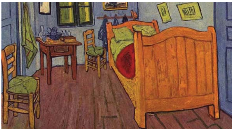
Autor: Vincent Van Gogh. (Fuente: http://artenarede.com.br ). Accedido el: 21/02/2018.