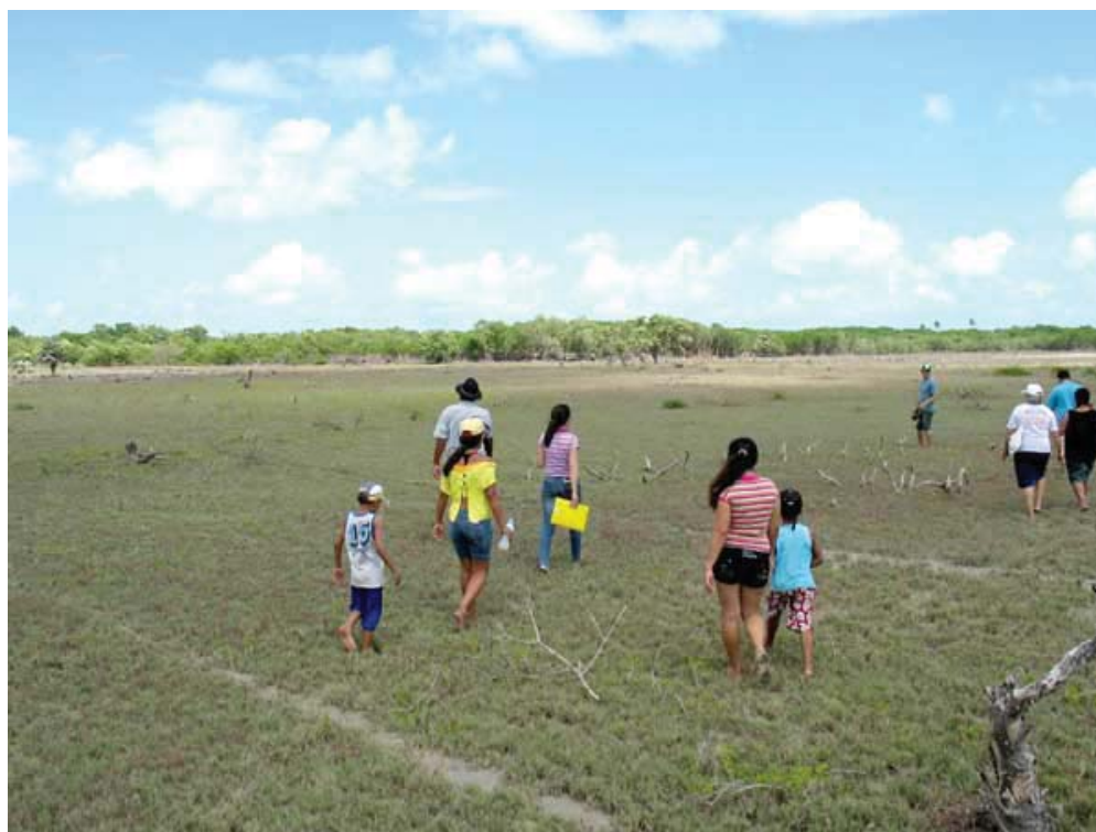
Figura 2: Pessoas caminhando em área descampada onde antes apresentava extensa vegetação de manguezal.

Cabe ao educador promover atividades de Educação Ambiental que permitam aos alunos oportunidades de desenvolver uma sensibilização dos problemas ambientais que o cercam e buscar formas alternativas de solucioná-los. Assim, os alunos irão identificar e definir problemas ambientais, buscar e organizar informações, formular estratégias, desenvolver e gerar um plano de ação (Fig. 2).