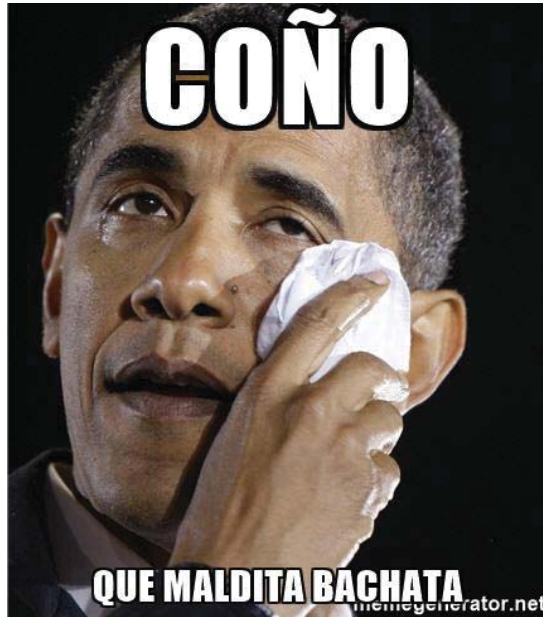
El presidente de los Estados Unidos Obama.