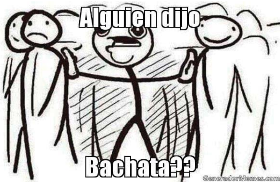
El comic.