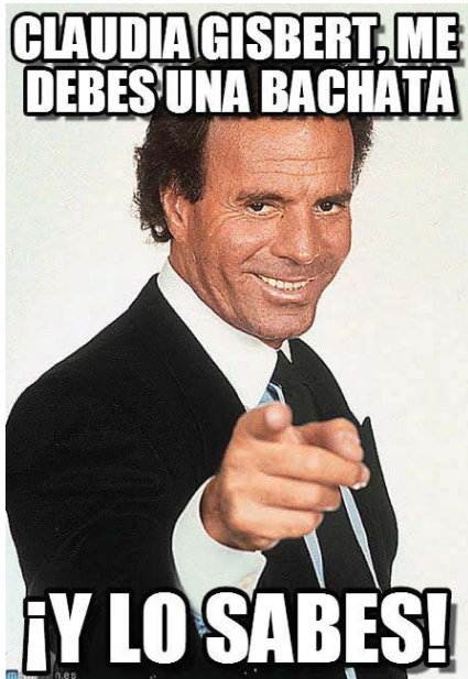
El cantante español Julio Iglesias (Fuente: http://www.memegen.es ).