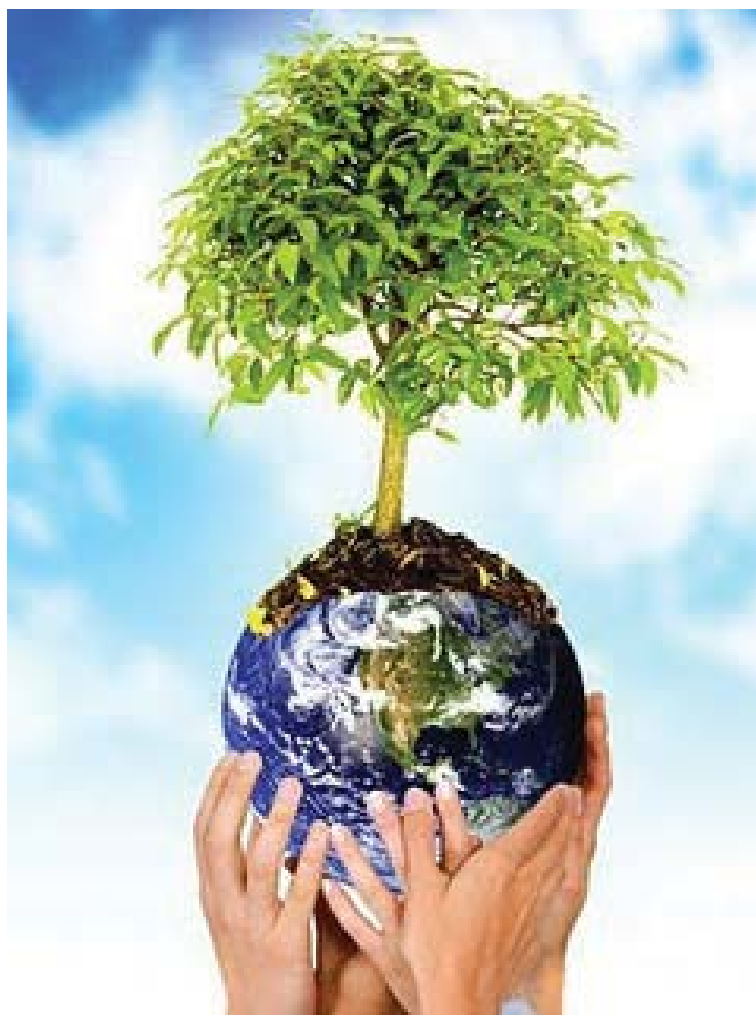
Figura 1: A Legislação Ambiental Brasileira é uma das mais completas do mundo.

O estabelecimento de uma política de Educação Ambiental no Brasil e seu conseqüente aparato legal surge no contexto histórico nacional no bojo das reflexões internacionais e mais explicitamente com algumas ações, tais como a criação e estabelecimento legal da Secretaria Especial do Meio Ambiente, conjugada a Presidência da República através do Decreto 73.030 em 1973, seguida em 1981 da instituição da Política Nacional do Meio Ambiente, pela Lei 6938, ordenando assim o arcabouço legal de outras ações relacionadas com o tema no país (Fig. 1).