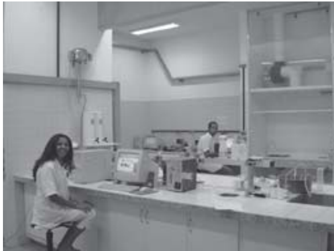
Legenda: Laboratório de Instrumentação e Automação para Análise Química da UFPE

Ao final desta aula, você deverá saber definir química analítica, distinguir entre a análise qualitativa e quantitativa e entender importância da química analítica. Você será capaz de descrever o procedimento de uma típica análise química, escolher o método de análise mais adequado, apontar e resolver os possíveis problemas em cada etapa como, por exemplo, acrescentar etapas como filtração, pré-concentração, precipitação, extração, separação de interferente, etc, e, por fim, avaliar os resultados encontrados.