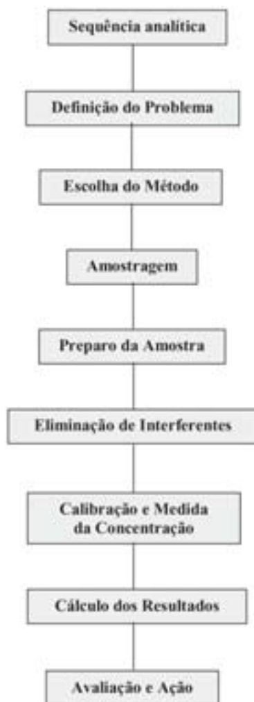
Figura 3. Fluxograma mostrando as etapas envolvidas em uma típica análise química.

Atualmente, o grande desafio para a química analítica é determinar um número cada vez maior de componentes, em quantidades cada vez menores, em um número crescente de amostras, no menor tempo, pelo menor custo.