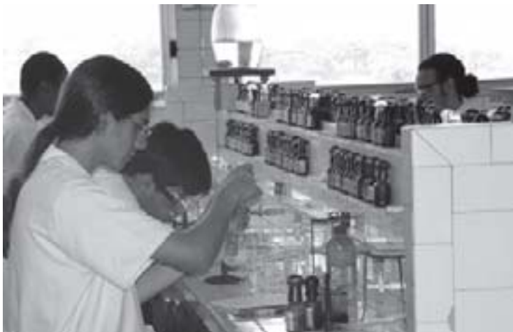
Estudante do curso de Química no Laboratório do Departamento de Química Analítica da UFRJ.