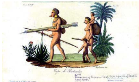
Botocudos. Maximilien de Wied-Neuwied

Em 1755, foi decretada a Lei de Liberdade que proibia definitivamente a escravização dos índios. No século XVIII, em relação aos povos indígenas, foi estabelecida a política do Diretório dos índios. O Diretório, implantado em 1757 no