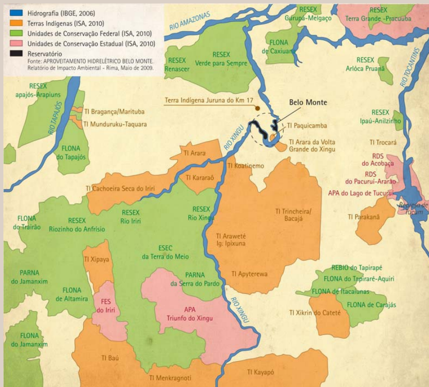
UHE Belo Monte: Terras Indígenas e UC's Federais no entorno