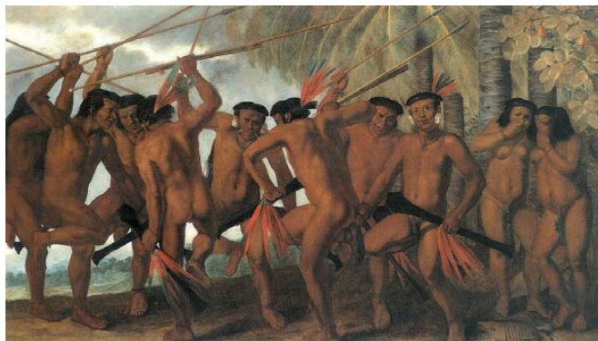
Dança tapuia. Albert Eckhout.

e partem da persuasão das tropas lideradas ou acompanhadas por um missionário. Para Almeida, 2010, p.76, os descimentos eram atividades importantes e essenciais para originar as aldeias e manter os níveis populacionais diante de um cotidiano de fugas, mortes, guerras, maus tratos e epidemias.