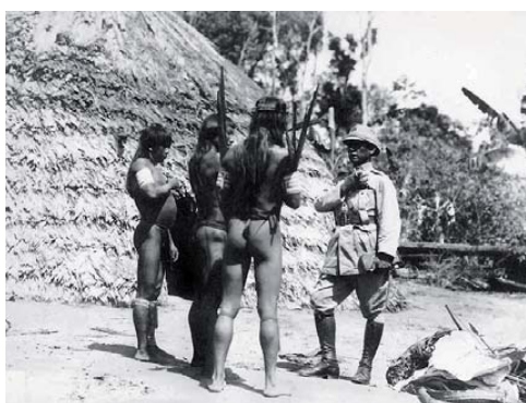
O Marechal Rondon diante de três Tiriýó.

O Marechal Cândido Rondon foi nomeado para trabalhar na chefia da Comissão Construtora de Linhas Telegráficas de Mato Grosso, com o objetivo de expandir as linhas pela fronteira do Mato Grosso e ao mesmo tempo promover a colonização e o desenvolvimento agrícola e pecuário da região.