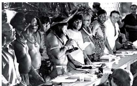
1º Encontro dos Povos Indígenas do Xingu. Na foto, Paulo Paiakan, Raoni, Marcos Terena, Ailton Krenak, vários deputados e o cacique Pombo.

A Constituição de 1988 estabeleceu o princípio da diversidade e da alteridade dos povos indígenas, a defesa de que devem ser respeitados em suas diversas culturas e que são cidadãos brasileiros portadores de direitos civis e políticos.