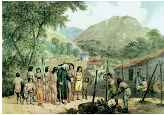
Rugendas. Aldeia de tapuias.

No período colonial, os índios eram divididos em livres ou aldeados e tapuias ou inimigos da Coroa portuguesa. Tal classificação envolvia relações complexas entre os povos indígenas e os europeus. Cabe ressaltar que os índios estabeleciam relações de aliança ou de conflitos conforme