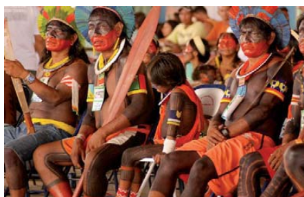
Índios Kayapó no Encontro Xingu Vivo para Sempre.

Em 1961, no governo do Presidente Jânio Quadros, foi criado o Parque Nacional do Xingu, resultado de uma luta dos irmãos Villas-Boas e o antropólogo e educador Darcy Ribeiro, cujo intuito era preservar não apenas as condições de sobrevivência dos povos, mas também o patrimônio natural dessa região.