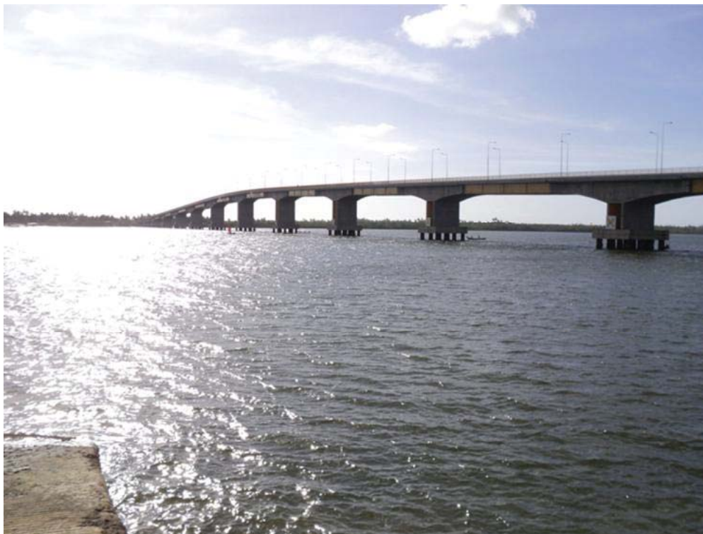
Figura 08 – Baixo curso do rio Vaza-Barris entre os municípios de Aracaju e Itaporanga D’ajuda.

No lado da Bahia, a maioria dos municípios inseridos no território da bacia utiliza os recursos subterrâneos para abastecimento diário da população e consumo animal, face à deficiência de água de superfície. No lado de Sergipe, suas águas superficiais com 187.547\text{m}^3/\text{mês} contribuem com mais de 90% para o abastecimento dos sistemas públicos (barragem Cajaíba, Aquífero cristalino, Riacho Ribeira, Riacho Taboca), enquanto as águas subterrâneas com 13.660\text{m}^3/\text{mês} contribuem com 6,79%. Em Sergipe alguns afluentes se destacam, tais como: Riacho Paramopama, rio das Pedras, rio Santa Maria, rio Salgado, entre outros.)