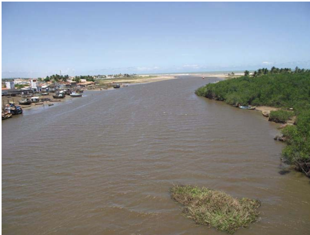
Figura 04 –Estuário do rio Japaratuba.

Os três principais rios dessa bacia são: Japaratuba, drenagem principal, Siriri, afluente pela margem direita, e Japaratuba Mirim, pela margem esquerda. Esses três eixos principais, desenvolvidos em rochas do complexo cristalino e da bacia sedimentar de Sergipe, recolhem os escoamentos da rede de drenagem da bacia (FONTES, 2007).