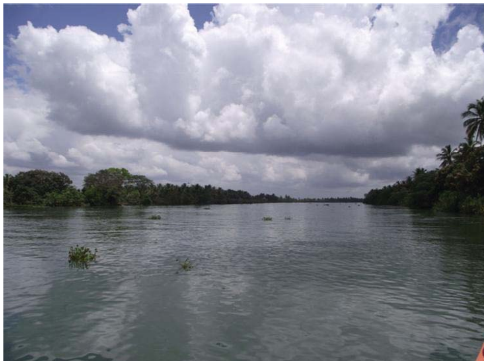
Figura 03– Baixo curso do rio São Francisco nas proximidades do município de Brejo Grande/SE.

Nas áreas correspondentes a margem direita do Médio, Submédio e Baixo São Francisco há predominância do tipo climático semi-árido, com vegetação típica de caatinga. Essas áreas pouco contribuem para os volumes de água que descem no rio, durante a estação seca, no período de maio a outubro.