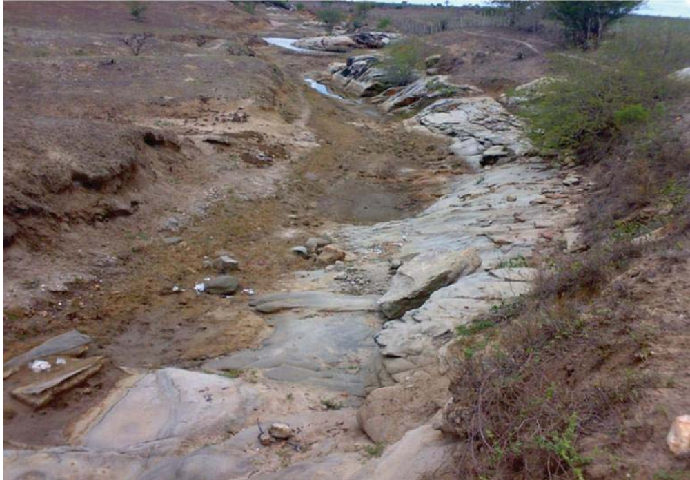
Figura 05 - Leito rochoso do rio Sergipe no curso superior em período de estiagem, município de Carira/SE. (Fonte: Hélio Mário de Araújo e Ivo Matias, 2009).

No médio curso a situação é bem diferenciada. Os afluentes apresentam, de modo geral, caráter de perenidade, atestado pela maior abundância e regularidades das chuvas, decorrente dos climas Megatérmico Subúmidos Seco (C1A'a') e Subúmidos (D1A''a'') e condicionalmente litológico (embasamento cristalino e bacia sedimentar).