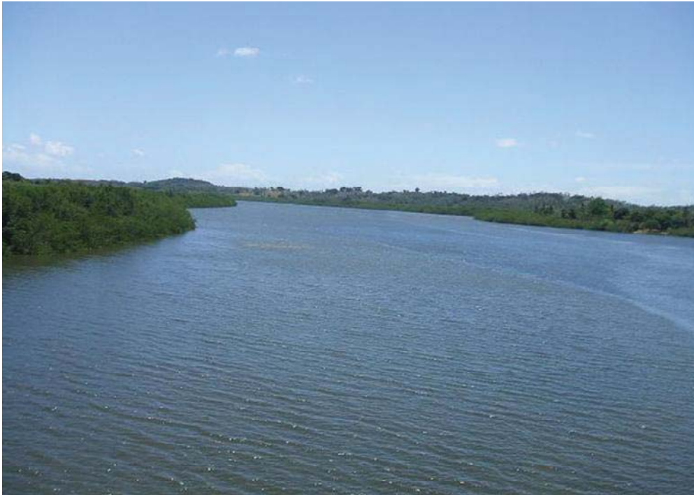
Figura 06 - Rio Sergipe em Pedra Branca, município de Laranjeiras. (Fonte: Helio Mário e Wellington Villar, 2007).