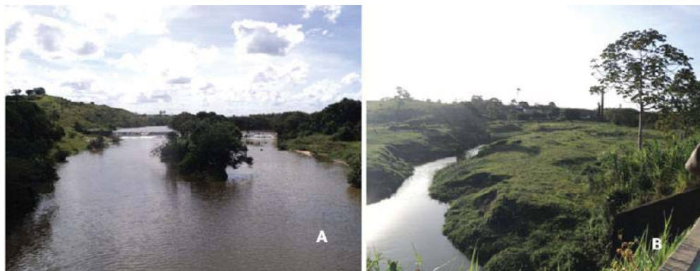
Figura 07 - A) Rio Piauí no município de Estância e B) Rio Guararema no município de Santa Luzia do Itanhy/SE.

O regime fluvial da bacia que reflete as variações de pluviosidade, contribui para a intermitência dos canais no alto e médio cursos. No baixo curso os canais são perenes em decorrência das chuvas abundantes e natureza permeável das rochas (Figura 07 B).