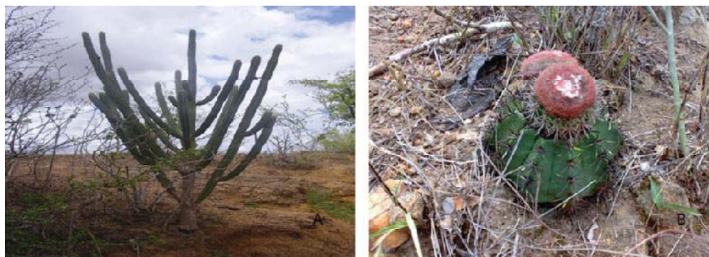
Figura 07 – A) Espécie de caatinga (facheiro) no município de Carira-SE. B) Figura 00 - Coroa-de-frade ( Melocactus bahiensis ) no município de Carira-SE. (Fonte: Hélio Mário de Araújo, 20090).

A caatinga é uma formação vegetal típica de clima semi-árido, cobrindo grande área do sertão sergipano (Figura 07 A e B). Abrange o estado de Sergipe de norte a sul, desde Caninde de São Francisco, no extremo noroeste, até o município de Tobias Barreto, no sudoeste. As espécies são esparsas entre si, com troncos tortuosos e folhas caducas. No período de seca, perdem as folhas, os troncos se ressecam e as gramíneas desaparecem, o solo fica desnudo e a paisagem cinzenta.