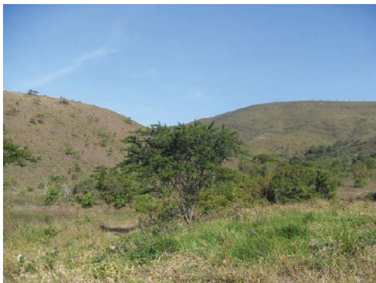
Figura 06 – Cerrado nas imediações da Serra Comprida no município de Areia Branca/SE..

Se diferencia das demais espécies de vegetação pelas características que lhes são peculiares: Tronco com casca grossa, rugosa e suberosa. Os galhos são Tortuosos. As Folhas podem ser duras, esclerofilas ou carnosas, cobertas de pêlos ou aveludadas. As espécies mais frequentes são: cajueiro ( Anacardium occidentale ), sambaíba ( Curetella americana ), pau-de-leite ( Plumeria bracteata ), entre outras.