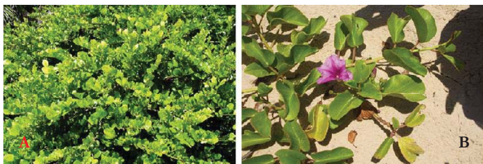
Figura 01 – A) Registro de Chrysobalanus icaco na praia do Jatobá/SE. B) Registro de Ipomoea pes-caprae na praia do Jatobá/SE. (Fonte: Jailton de Jesus Costa, 2008).

São associações constituídas de vegetação herbácea onde a brisa marinha impede o desenvolvimento dos arbustos e árvores. Ocorrem geralmente nas proximidades da linha de costa, estando fora do alcance das marés mais altas. Esta vegetação serve para fixar as areias das dunas móveis. Antes da fixação, as dunas móveis levadas pelo vento podem recobrir a vegetação, que se renova para reconquistar e cobrir o solo nu. Entre as espécies vegetais, destacam-se a salsa-da-praia ( ipomea pés-caprae ) e grama da praia ( sporobulus virginicus ). Sua fauna é constituída basicamente de gore (um pequeno caranguejo)(Figuras 01 A e B).