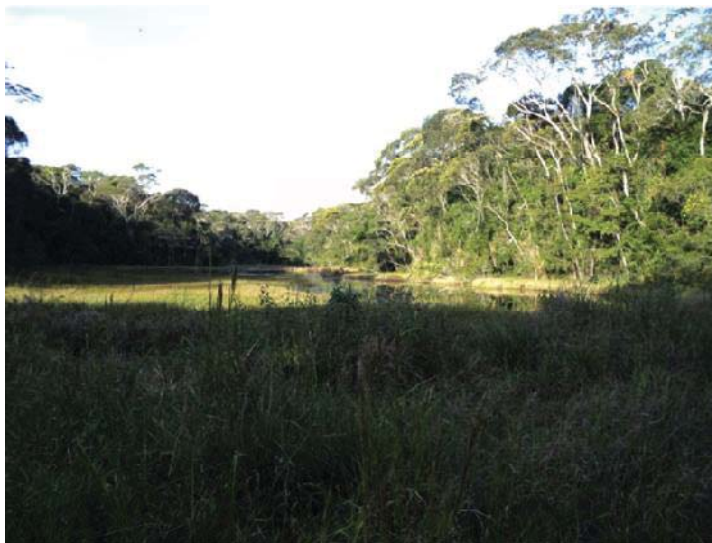
Figura 04 – Mata Atlântica no povoado do Crasto em Santa Luzia do Itanhy/SE.

Esse tipo de vegetação inclui apenas manchas nos estágios médios e avançados de regeneração, onde o predomínio das espécies arbóreas de alto porte é mais elevado. Atualmente pouco resta da Mata Atlântica no Estado de Sergipe quando comparado com o passado. Segundo Wanderley(1998) há cerca de quarenta anos atrás essa formação ocupava, junto com outras formações naturais, uma superfície bem maior do que a atual, fato que levou Sergipe a ser considerado um Estado bem devastado. Essa situação é constatada em 1976 a partir do Zoneamento Ecológico-Florestal do Estado, quando demonstrou que em finais dos anos de 1950, as estimativas já indicavam que dos 10.000km 2 de florestas primitivas e 11.000km 2 de caatingas ainda intactas à época do descobrimento, Sergipe possuía apenas 2.000km 2 de florestas primitivas, 4.000km 2 de caatingas intactas e 16.000km 2 de áreas cobertas com formações artificiais formada às custas de outras formações vegetais.