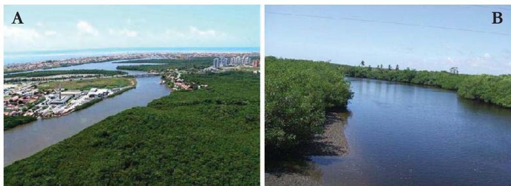
Figura 01 – A) Rhizophora mangle nas margens do Rio Poxim (baixo curso) nas imediações dos bairros Inácio Barbosa e Farolândia/Aracaju./SE. B) Rhizophora mangle no baixo curso do rio Pomonga, Barra dos Coqueiros/SE. (Fonte: A) Lineu e Maurício 2000 e B) Hélio Mário e Wellington Vilar, 2007).

Os manguezais localizam-se nas desembocaduras dos rios, nas áreas estuarinas até onde as águas do mar se misturam com as águas dos rios, compondo o ambiente salobro e lodoso dos solos indiscriminados de mangues. Neles se desenvolvem espécies vegetais adaptadas à salinidade e saturação hídrica, como estratos arbustivos ou arbóreos com raízes aéreas, que dão sustentação ao vegetal e permitem a sua respiração (FONTES, et al. 2007).