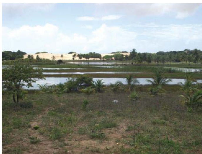
Figura 05 – Campo de várzea no município de Pacatuba/SE. (Fonte: Hélio Mário Araújo, 2011).

Os Campos de Várzeas e Brejos constituem vegetação densa de poáceas e ciperáceas, que ocupam as margens dos cursos de águas onde ocorre acumulação de águas provenientes das cheias com drenagem insuficiente para o escoamento das águas. A vegetação é composta de plantas higrófilas e hidrófilas.