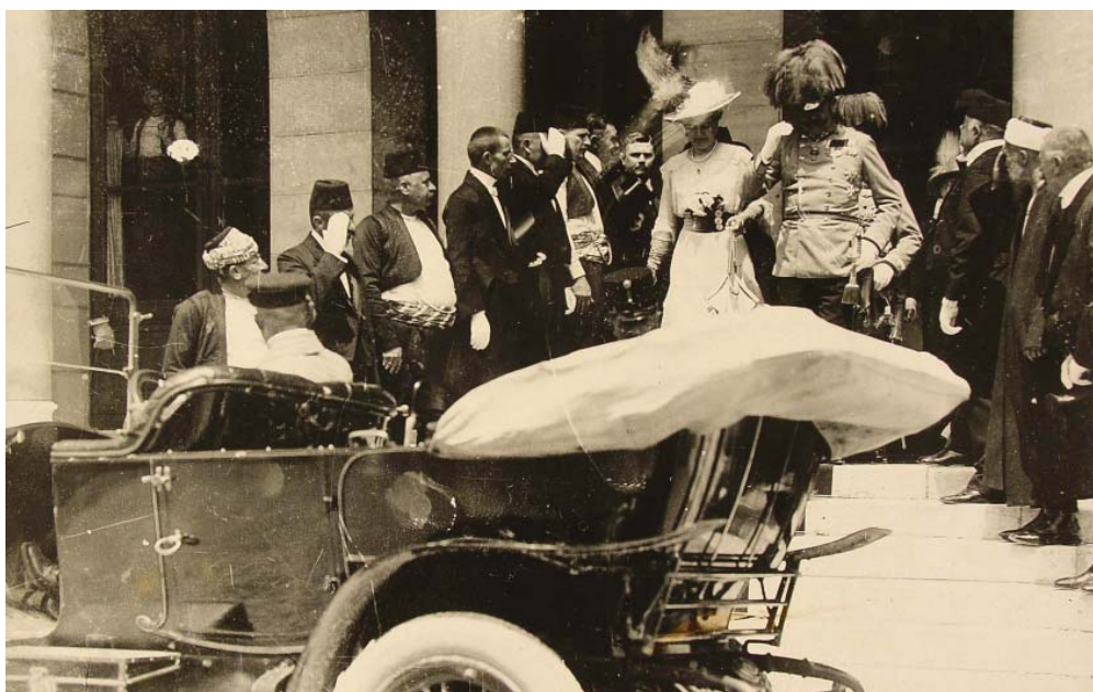
Arquiduque Francisco Ferdinando e sua esposa, na cidade de Sarajevo, em 1914.

Caro (a) estudante. Deve ser do seu conhecimento que um fato é comumente apontado como o estopim para o início da Primeira Guerra Mundial: o assassinato do herdeiro do trono austro-húngaro , o arquiduque Francisco Ferdinando (Franz Ferdinand) e sua esposa, na cidade de Sarajevo, em 1914.