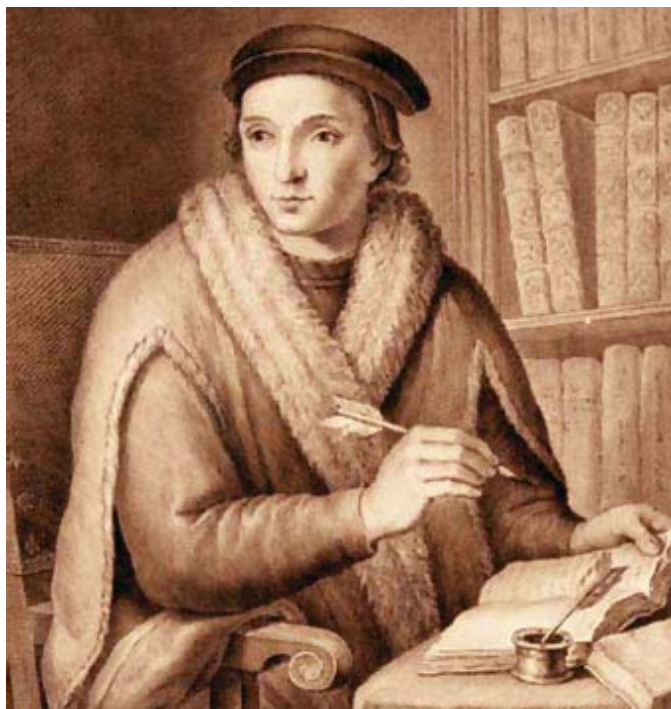
Juan Luis Vives.

Juan Luis Vives: Pensador español (Valencia, 1492 - Brujas, Flandes, 1540). Nacido en una familia de judíos conversos, estudió en las universidades de Valencia y París. Desde 1512 se estableció en Flandes, donde fue profesor de la Universidad de Lovaina y entabló una estrecha relación con Erasmo de Rotterdam. También mantuvo amistad intelectual con Tomás Moro, que le llevó a enseñar en la Universidad de Oxford desde 1523.