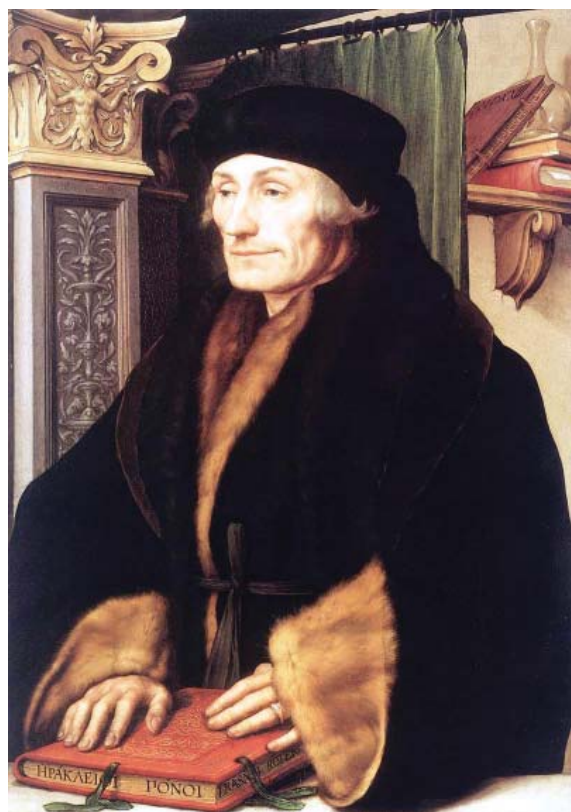
Erasmus de Róterdam.

social, para devolverle la capacidad creadora, la libertad y la dignidad que el ser humano tenía en la Antigüedad griega y latina.