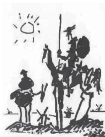
Dom Quixote, personagem criado por Miguel de Cervantes em obra homônima publicada em 1605, retrata um mundo em transição do medievo para a modernidade.

A chamada Idade Moderna é compreendida de 1453 até 1789, ano da eclosão da Revolução Francesa. Caracterizou-se pelo nascimento do modo de produção capitalista. A denominada Idade Contemporânea abarca de 1789 até os dias atuais.