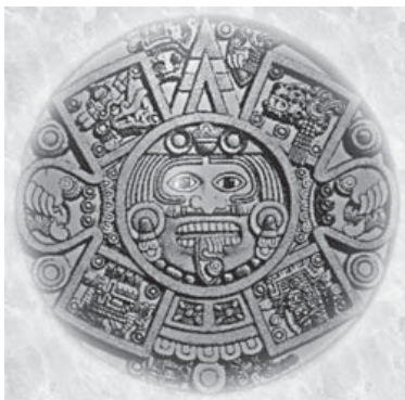
Sol Asteca. (Fonte: http://mexico-ayotl.org ).

O fato é que uma periodização da História é sempre uma interpretação. Uma interpretação dos dados históricos, disponíveis a um historiador em certa época e sempre vistos pelo prisma da sua “situação” no tempo. O número de dados não cessa de aumentar no decurso dos séculos, e os pontos de vista variam incessantemente de acordo com as sempre variantes “situações históricas”. Não é possível uma periodização estritamente “científica” da matéria histórica: os períodos adotados nunca são unidades naturais no sentido de se apresentarem espontaneamente ao historiador como unidades unívocas. A periodização do passado é sempre condicionada pela situação do historiador atual.