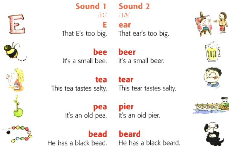
(SILVA, 2012, p. 70)

Vamos praticar um pouco mais o fonema /ɪə/? Analise os minimal pairs da Figura 3, e leia em voz alta cada par de palavras, contrastando os fonemas /i:/ e /ɪə/.