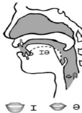
(SILVA, 2012, p. 205)

E em relação ao posicionamento da língua e da boca? Você conseguiu perceber os movimentos dos articuladores para a produção desse fonema? Observe a movimentação da língua e da boca para a produção do fonema /ɪə/ na Figura 2