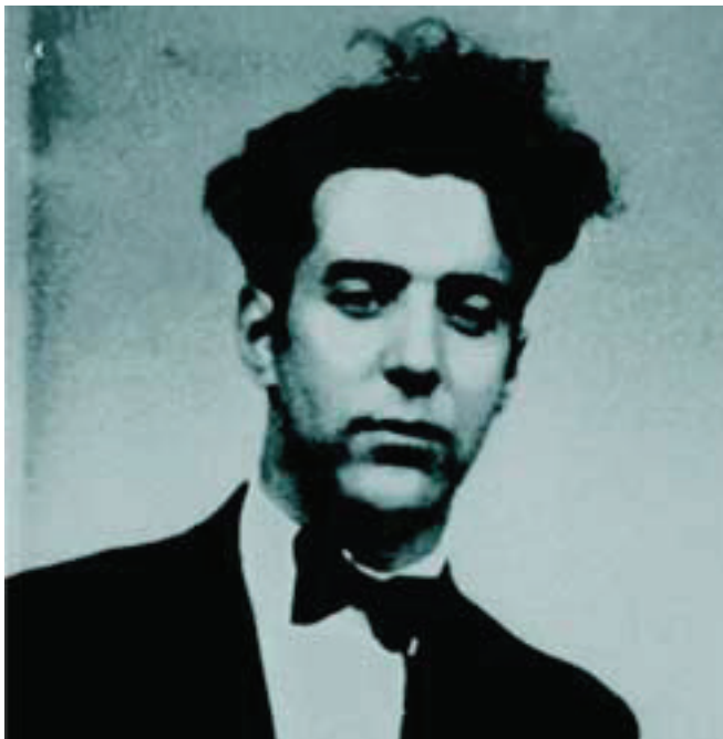
“Retrato de Felisberto Hernández”. Disponible en: http://cvc.cervantes.es/literatura/escritores/fhernandez/ . Accedido el: 18/07/2016.

Nota: El autor persigue a su yo todos los días, pero solo escribe algunos; estos se distinguen por números y no por fechas. La forma es de diario] (HERNÁNDEZ, [¿1957?] 1988, p. 186)