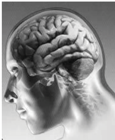
A morte encefálica. (Fonte: http://t2.gstatic.com ).

O conceito de morte encefálica é aceito pela comunidade científica mundial e trata de verificar e atestar a ocorrência de dano encefálico irreversível, que possa vir a impossibilitar a manutenção das funções vitais. No caso de sua constatação, devem-se empregar os recursos de terapia intensiva para garantir a manutenção vital dos demais órgãos, durante um período que possibilite sua utilização em transplantes. No Brasil, sua constatação exige a realização de exames complementares para atestar a irreversibilidade do quadro, disciplinada pela Resolução CFM nº 1.480/97, conforme determina a Lei nº 9.434/97, exigindo a participação de dois médicos que não pertençam à equipe de transplantes. Constatada a ocorrência de morte encefálica, é imprescindível a notificação urgente aos órgãos competentes, sendo esta de caráter compulsório, com a finalidade de possibilitar agilidade nos procedimentos necessários a sua retirada e garantir a viabilidade daqueles aptos a utilização.