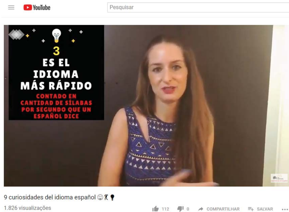
Imagen 04 - 9 Curiosidades del Idioma Español

Te sugerimos el video representado a continuación, disponible en Nuestro Ambiente Virtual de Aprendizaje.