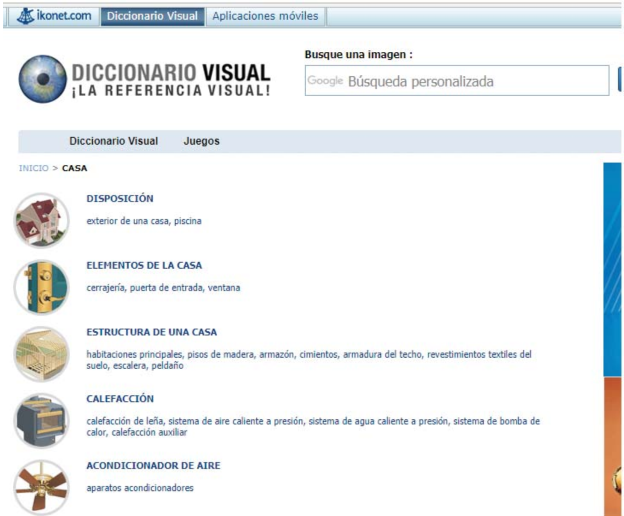
Imagen 02 – Diccionario Visual (Casa).