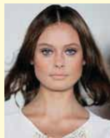
EL PELO SUELTO