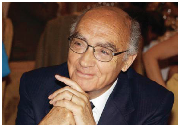
José Saramago.