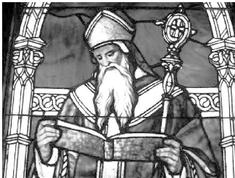
Agostinho de Hipona, detalhe de vitral situado na cidade de Saint Agoustine, Flórida, eua. (Fonte: http://upload.wikimedia.org ).

O aluno deverá revisar os assuntos relativos a Filosofia Medieval.