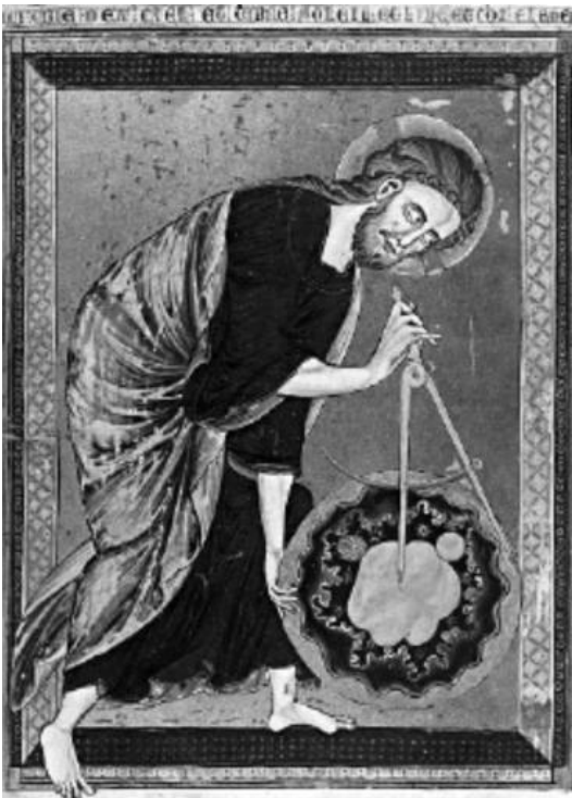
Deus criando o universo seguindo os princípios geométricos.

A solução para este problema nos parece interessante, embora não de todo resolvido, consiste em pensar que, para Tomás, o sensível não significa somente as coisas materiais. O sensível está constituído