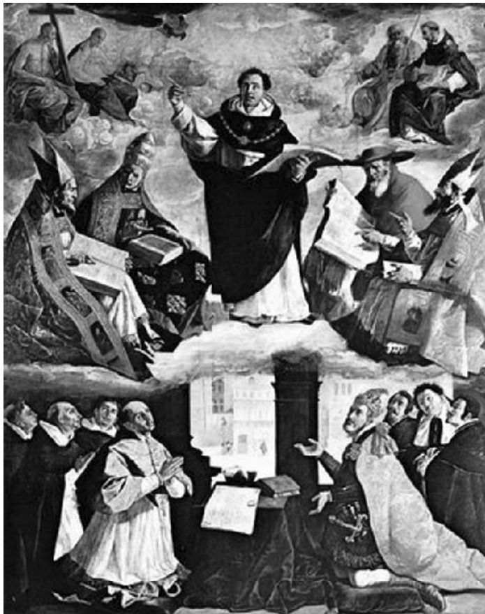
Apoteose de São Tomás de Aquino, pintura, Francisco de Zurbarán, 1631, Museu de Belas Artes de Sevilha-Espanha. (Fonte: http://bp1.blogger.com ).

O aluno deverá ter noções sobre os problemas filosóficos presentes na obra de agostinho de Hipona.