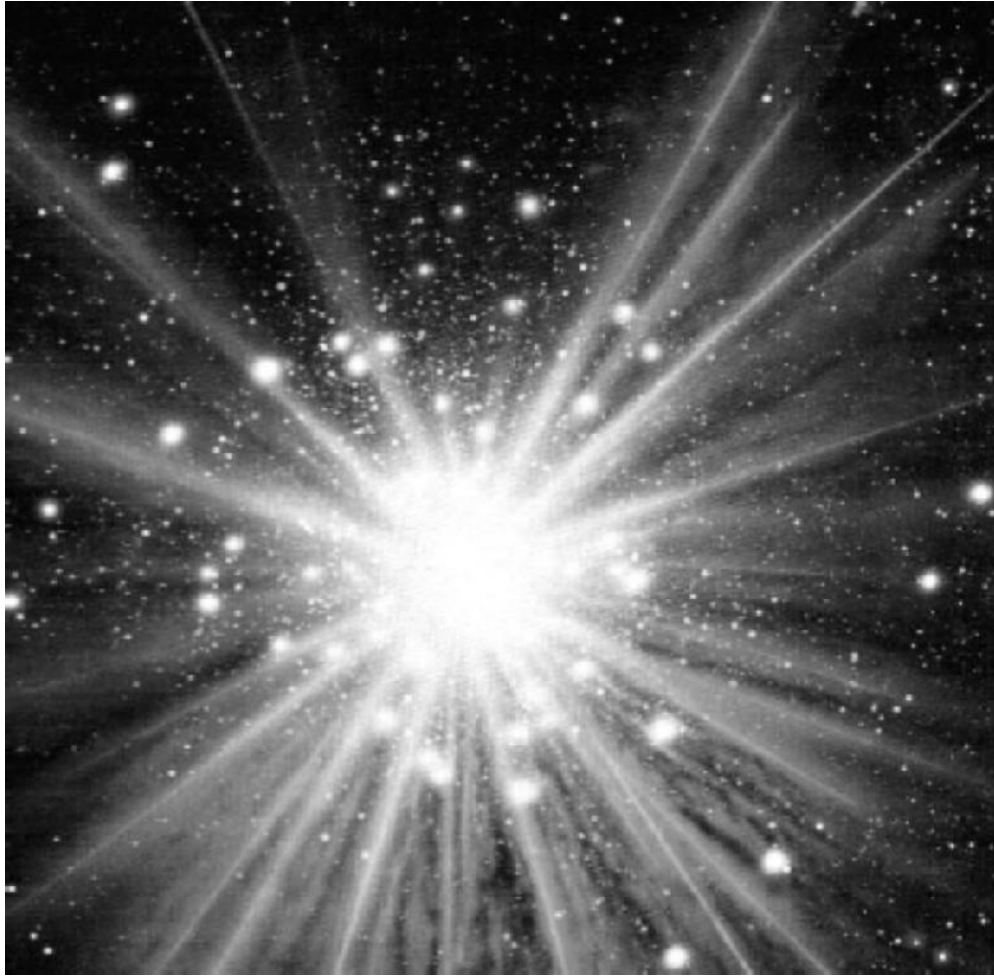
Big bang. (Fonte: http://www.biblelife.org ).

Leiamos o argumento de Tomás de Aquino sobre estes pontos: