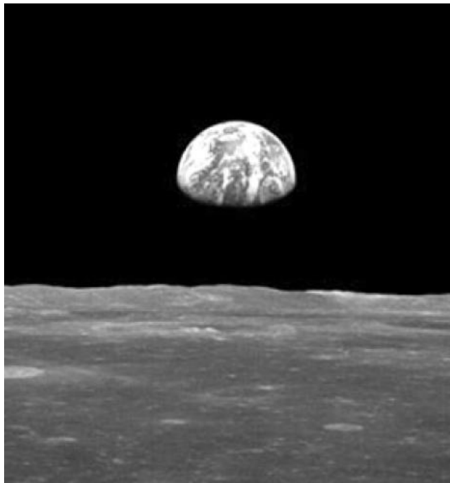
Planeta Terra visto da lua. (Fonte: http://celulasdecombustivel.planetaclix.pt ).

O argumento segue, em linhas gerais, as conseqüências da evidência do movimento (no mundo). Segundo Aristóteles, é tarefa da filosofia indagar sobre o princípio do movimento e, sendo ele eterno, qual seria seu primeiro motor?.