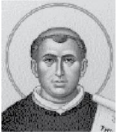
Tomás de Aquino

Foi um dos maiores expoentes da Escolástica medieval. (1225-1274).