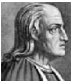
Anselmo de Cantuária

Para Aquino, a demonstração é possível por dois modos ou espécies ( Respondeo dicendum quod duplex est demonstratio ) que são: pelas causas ( per causam ) ou princípios e pelos efeitos ( per effectum ). Defende o filósofo que pelo efeito pode-se conhecer melhor a causa já que o efeito é mais