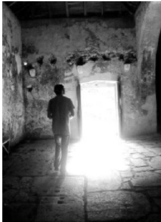
Porta aberta.

É importante ressaltar que esta prova, contrariamente as demais, não tem uma referência histórico-filosófica precisa, posto que era comum, tanto nos textos bíblicos como em muitos pensadores cristãos, referências a um Deus criador e ordenador de todo o universo. Em linhas gerais, este argumento tem como ponto basilar a necessidade de uma inteligência ordenadora que garanta a ordem das coisas. A harmonia presente na natureza é, para Tomás, a prova de uma causa final que justifica, não apenas a razão de uma ordem na natureza, mas a razão pela qual a natureza existe.