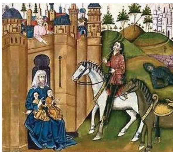
Caballero Zifar.

la figura de un caballero, en cierto modo andante, y algunos episodios típicos de las novelas de caballerías, de clara procedencia francesa y bretona. No quiero afirmar que estos hechos carezcan de importancia dentro de la obra, pero sí que son secundarios en cuanto a su desarrollo básico, ya que están vagamente vinculados al resto de la novela. Más bien, el Caballero Zifar pertenece al género didáctico-moral. Esta fusión no bien integrada de géneros se da en toda la literatura imaginativa del Medioevo, precisamente porque los géneros literarios aún no se habían deslindado del todo de los no literarios: de ahí que los fines didácticos gravitasen sobre toda obra literaria.