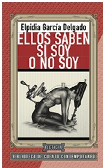
“Tapa de Ellos saben si soy o no soy”. Disponible en: http://www.ficticia.com/libreria/libro/ellos_saben_si_soy_o_no_soy . Accedido el: 20/07/2016.