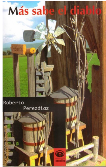
“Tapa de Más sabe el diablo”. Disponible en: http://borderzine.com/2012/04/mas-sabe-el-diablo-que-el-escritor-roberto-perzdiaz/#prettyPhoto . Accedido el: 20/07/2016.