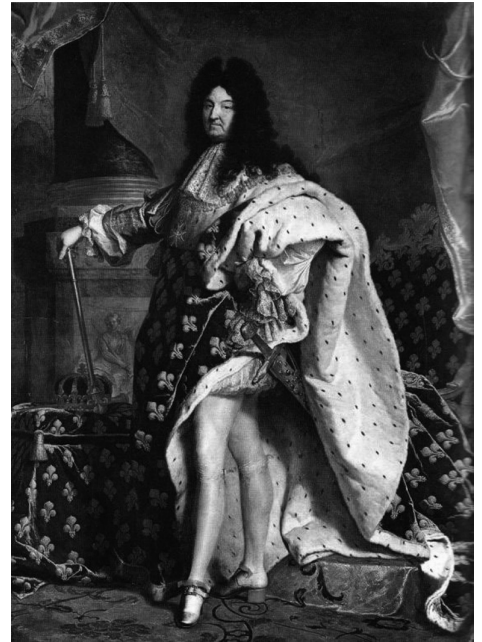
Figura 4 - Luís XIV.

Foi nessa perspectiva que o Estado nacional absolutista adotou uma “política econômica” centrada na idéia de que o enriquecimento do príncipe (Estado) e dos proprietários comerciantes viria de uma postura estatal que criasse impedimento para a “saída de metais preciosos, através da proibição de sua saída e da limitação das importações; facilitar a entrada deles, encorajamento as exportações do que não é necessário no reino; tanto uma como a outra levam ao encorajamento das produções nacionais. (...). Está aberto o