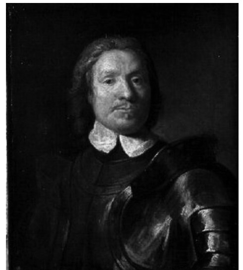
Figura 7 - Oliver Cromwell.

O desenvolvimento da política mercantilista pelo Estado Moderno, na Inglaterra, deu-se centrado na expansão do comércio externo apoiado em uma