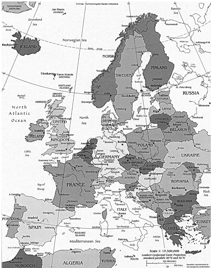
Figura 2 - Mapa político da Europa ocidental.

e, de outro, um grupo de vendedores que nada tem para além de sua força de trabalho, seus braços laboriosos e seus cérebros”(MARX, 1998, p.28).