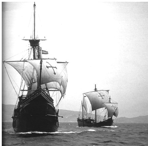
Figura 8 - Réplica das caravelas que descobriram a América.

A mudança contribuiu para a decadência dos centros comerciais que se desenvolveram durante a Antigüidade greco-romana e durante a Idade Média à margem do Mediterrâneo, em favorecimento das cidades localizadas