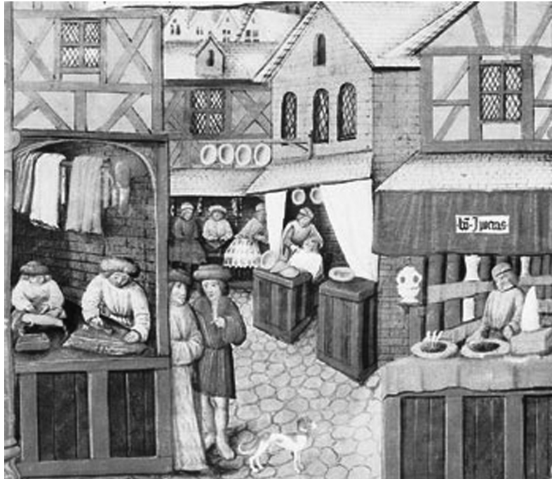
Figura 6 - Feira em uma cidade medieval.

A política mercantilista teve como elemento central a montagem do sistema colonial baseado na relação de exclusividade, que consistia no estabelecimento de monopólio exercido pela metrópole sobre a colônia, que tinha a função de produzir especiarias e consumir produtos originários na metrópole.