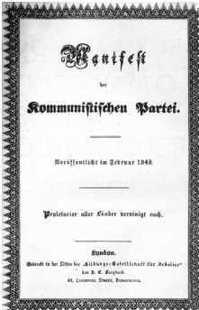
Figura 3 - Capa do Manifesto Comunista, publicada em 1848, em Londres (Fonte: Martin Claret, 1985, p. 47).

A transformação no agrário adveio da ocorrência de dois processos que aconteceram combinados: um que contribuiu para a formação de um pequeno grupo de pessoas, proprietário de grande volume de recursos (dinheiro, metais preciosos e meios de produção) - os burgueses. O outro,