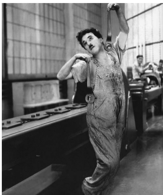
Figura 1 - Cena do filme Tempos Modernos - EUA, 1936 - Charles Chaplin.

A reflexão sobre a História Econômica tem carregado uma tradição de indicar a atividade econômica como sendo a atividade motora do desenvolvimento da humanidade. Essa tradição teve início no século XIX, a partir de alguns argumentos sugeridos pela Escola Clássica Liberal, e foi reforçada pela versão economicista do Materialismo Histórico. A tradição de colocar a economia como a atividade motora do desenvolvimento na humanidade não encontra muito amparo na academia, hoje, pois, como sugere Eric Hobsbawm (1998), nem sempre o movimento da história, ou da própria economia, pode ser decorrente unicamente do econômico.