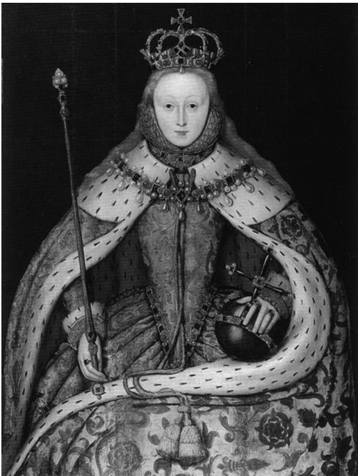
Figura 5 - Elizabeth I.

Monarcas ávidos de grandezas e de riquezas, Estado lutando pela supremacia, mercadores e banqueiros encorajados ao enriquecimento: são estas as forças que promoverão o comércio, as conquistas e as guerras, sistematizarão a pilhagem, organizarão o tráfico de escravos, prenderão os vagabundos para obrigá-los a trabalhar (BEAUD, 1987, p. 40).