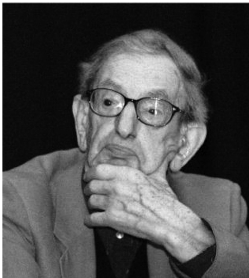
Figura 2 - Eric Hobsbawm.

Esse período também foi marcado pela perda da hegemonia do capitalismo europeu, liderado pela Inglaterra, pela ascensão do capitalismo dos Estados Unidos da América, pela consolidação do Capitalismo monopolista e financeiro, e pelo Estado planejador dos assuntos econômicos. Este será o assunto desta aula.