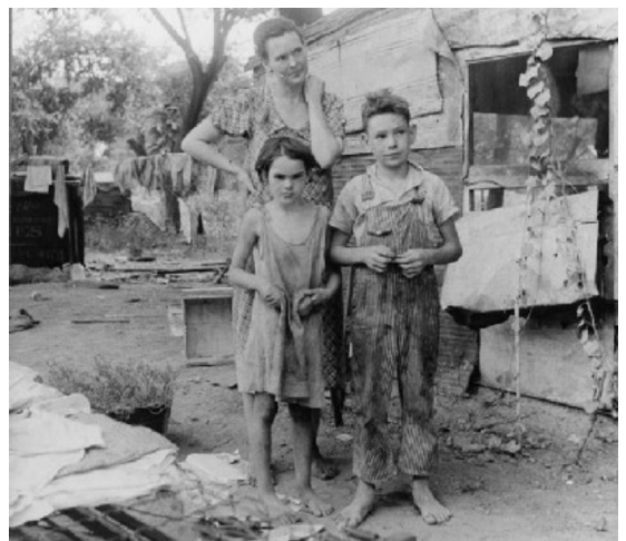
Figura 4 - Família desempregada, vivendo em condições miseráveis. A Grande Depressão causou pobreza geral nos Estados Unidos e em diversos países do mundo.

Lentamente, estava se montando a situação que geraria a crise que assolaria a economia mundial capitalista no início do século XX, que pode ser resumida como sendo uma crise provocada pela superprodução e especulação. A produção agrícola americana ampliada pela industrialização começou a perder o mercado consumidor criado no pós-guerra com a recuperação da produção agrícola de países europeus, situação que contribuiu para aumento de excedente que se tornava cada vez mais impossível de ser consumido por falta de mercado interno e externo. Situação que se agravou