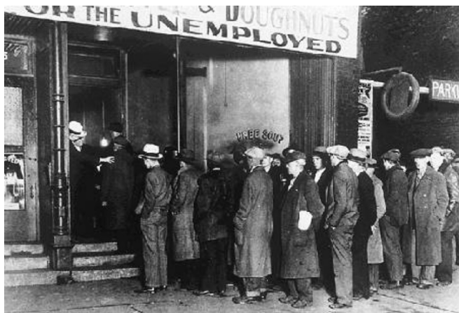
Figura 5 - Desempregados fazem fila para tomar a sopa gratuita em Chicago (EUA), durante a crise econômica da década de 1930. (Fonte: www.miniweb.com.br ).

mais ainda pela redução forte dos salários dos trabalhadores americanos, forçando a redução do consumo. A diminuição do consumo dos produtos agrícolas impedia que esse setor da economia acumulasse o suficiente para demandar produtos industrializados (tratores, máquinas, insumos e outros produtos). A redução do consumo atingia toda a economia, desde agricultura a produtos industrializados, o que gerou uma crise de superprodução. A diminuição do mercado consumidor provocou falência generalizada das empresas e o aumento do desemprego.