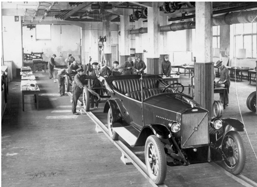
Figura 1 - Indústria Automobilística.

Rever as aulas sobre: Ideologia Liberal, Revolução Industrial e O Capitalismo Concorrencial.