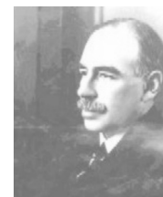
Jonh M. Keynes

No Brasil, a repercussão do “crack” da bolsa de Nova Iorque foi trágico, causando a falência de 579 fábricas devido à redução do consumo, o desemprego atingiu dois milhões de pessoas, os salários dos trabalhadores urbanos caíram em média 45% e os dos trabalhadores rurais acumularam uma queda de 53%. As medidas de restrições ao crédito e as políticas protecionistas adotadas pelos países consumidores dos produtos brasileiros, principalmente os Estados Unidos e Inglaterra, forçaram a queda do valor do principal produto da pauta de exportação brasileira, o café, que teve seu preço reduzido da saca de 200 mil reis, em 1929, para 21 mil reis, em 1930. (REZENDE, 1999).