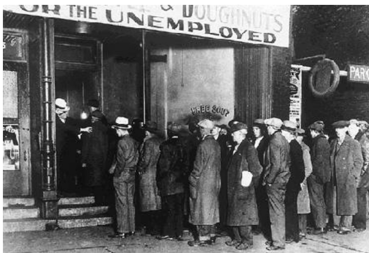
Figura 5 - Desempregados fazem fila para tomar a sopa gratuita em Chicago (EUA), durante a crise econômica da década de 1930.

Junto à crise de superprodução atuou a especulação financeira nas bolsas de valores locais de venda de ações das empresas. A Bolsa de Nova Iorque, uma das mais importantes da época, viveu, durante os anos vinte, uma agitada época de valorização das ações comercializadas, seguindo a empolgação da prosperidade que dominou a economia dos EUA, através de cotações altíssimas das ações, sem o cuidado de verificar a realidade econômica das empresas, facilitando um forte movimento especulativo. A falsidade do valor de suas ações veio à tona quando começaram a falir determinadas empresas, causando pânico entre os investidores, que atingiu o auge no dia 24 de outubro de 1929, a “Quinta-feira Negra”, o dia do “crack” da bolsa de Nova Iorque. A crise durou três anos. Nos Estados Unidos, foram à falência 4 mil bancos, 14 milhões de pessoas ficaram desempregadas, os salários acumularam uma perda de mais de 40% e a renda nacional diminuiu em mais ou menos 50%. Essa situação gerou uma crise sem precedente na economia mundial e as medidas aplicadas para a superação da crise modificaram radicalmente o capitalismo, desmontando a idéia de um capitalismo liberal, em que a livre concorrência ajustaria o mercado.