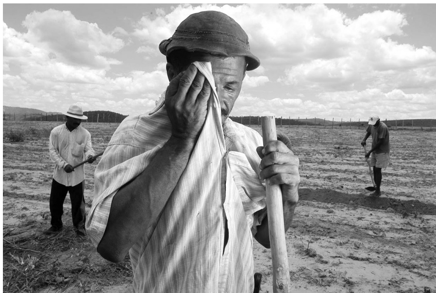
Figura 4 - Camponeses.

Ao estudar o camponês no Nordeste, FORMAN (1979), mostra que o trabalho camponês existiu paralelo ao regime de plantation. Essas unidades de produção eram formadas por pequenos sítios e, em parte, foram responsáveis pelo desenvolvimento do comércio interno colonial, assim