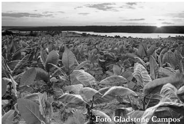
Figura 3 - O cultivo do fumo ainda se constitui em uma atividade econômica importante no Brasil atual.

O cultivo do fumo foi outra atividade que se desenvolveu no Brasil colônia, tornando-se um dos principais produtos explorado no período colonial. No início, era cultivado nos quintais e consumido, principalmente, pela população pobre (marinheiros, soldados, colonos pobres etc.). Posteriormente, tornou-se um produto utilizado em grande escala para aquisição de escravos africanos.