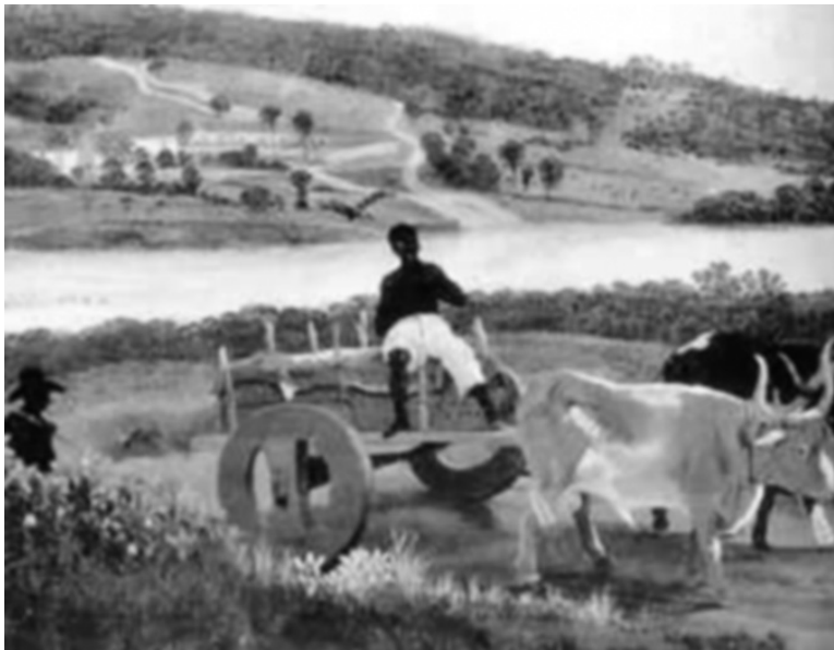
Figura 1 - Pecuária no Brasil colônia

Ter assimilado o conteúdo das aulas 14 e 15.