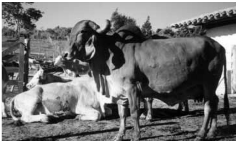
Figura 2 - Gado Bovino

Ara esta discussão nos basearemos principalmente nos trabalhos de Celso Furtado, Jean Baptiste Nardi e Caio Prado Júnior. Convém lembrar que a economia colonial era formada por dois setores. Um setor voltado para o mercado externo, produzindo: açúcar, tabaco, metais preciosos etc. e um setor voltado para o mercado interno, produtor de alimentos tendo como base principal o trabalho familiar.