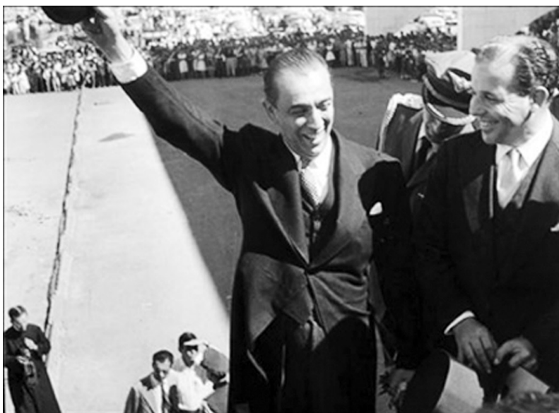
Figura 2 - Governo JK.

Para a abordagem desse tema, nos fundamentaremos principalmente na obra de Cyro Rezende (1999).