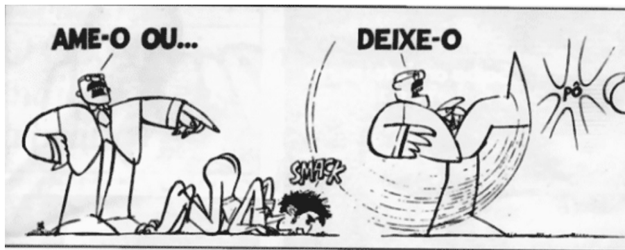
Figura 6 - Almanaque do Ziraldo, julho de 1979.

A instabilidade política inaugurada com o golpe militar de 1964 foi seguida pela instabilidade econômica por conta do descrédito dos credores internacionais e uma inflação crescente. Nesse contexto, foi elaborado da gestão de Castelo Branco (1964/1967) O PAEG (Plano de Ação Econômica do Governo), que teve como elaboradores os ministros: Roberto de Oliveira Campos (Planejamento) e Octávio Gouveia de Bulhões) Fazenda). Esse Plano econômico foi aplicado com base nos instrumentos clássicos de estabilização, ou seja: