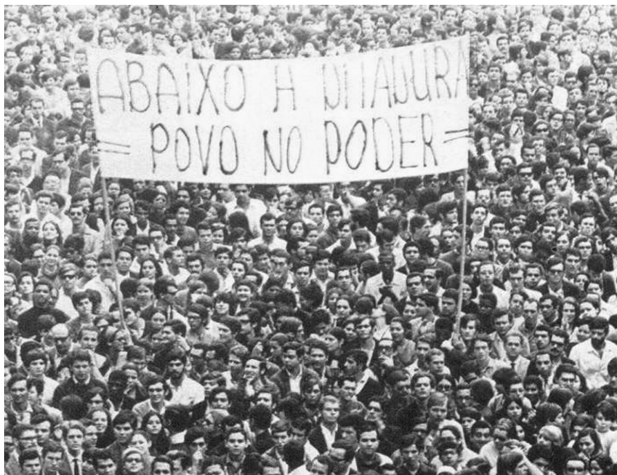
Figura 4 - Mobilização Popular.

Brasília e não ter quorum suficiente a sua carta de renúncia só seria apresentada na segunda feira, tempo suficiente para mobilização popular. Na verdade o tiro saiu pela culatra, pois com quorum suficiente o Congresso aceitou a sua renúncia.