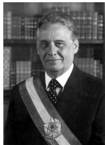
Fernando Henrique Cardoso