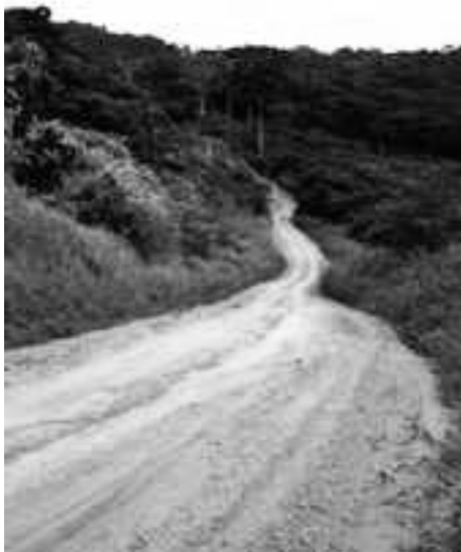
Figura 8 - Transamazônia. Dos sonhos do Plano de Integração Nacional e do “Brasil Grande” do regime militar, resta uma pista de terra vermelha e amarela que é, durante seis meses, poeira e outros seis meses, lama..

O II PND tinha como objetivos: um aumento anual de 10% para o PIB, o crescimento da indústria de bens de capital, a produção de insumos básicos, expansão dos setores energéticos. Além disso, pretendia o Governo diminuir as disparidades regionais com a implantação de projetos regionais como o POLONORDESTE e o POLOA-MAZÔNIA. Em 1975 foi assinado o acordo Nuclear com a Alemanha que previa a instalação de oito centrais termonucleares. Ainda no setor energético foi criado o PROALCOOL (Programa Nacional do álcool) para produzir álcool combustível para automóveis.