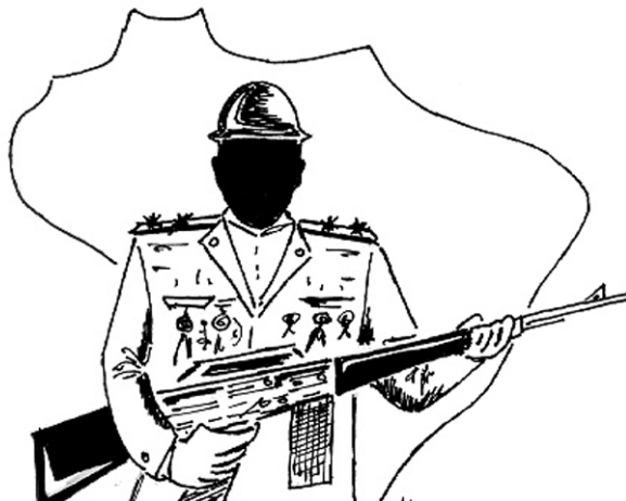
Figura 1 - Regime militar.