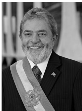
Luiz Inácio Lula da Silva

Quanto ao processo inflacionário, no último ano do governo FHC a inflação atingiu a casa de 12,53%. Em 2005 foi registrado apenas 5,69%.