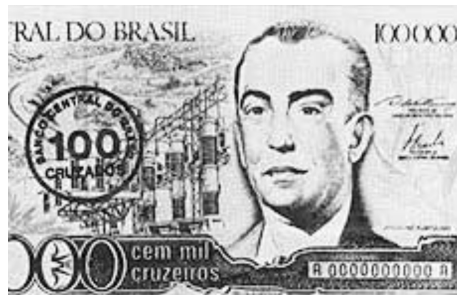
Figura 11 - Nota de 100 cruzados (detalhe).

Em junho de 1987, foi elaborado outro plano de estabilização, denominado de PLANO BRESSER tendo como responsável o ministro da Fazenda Luis Carlos Bresser Pereira. Para controlar a inflação e reduzir o déficit público, os salários, os preços e os aluguéis residenciais e comerciais foram congelados durante três meses e o cruzado sofreu uma desvalorização de 9,5%. Fracassado esse novo plano pois os objetivos propostos não foram alcançados inclusive a inflação continuou aumentando, em janeiro de 1989 o Governo lançou o PLANO VERÃO.