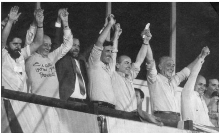
Figura 9 - Comício pelas Diretas Já.

Nesse difícil contexto econômico, as oposições se mobilizaram através do movimento “Diretas Já”, que mobilizou em todo o país milhares de pessoas que reivindicavam o fim do regime militar. Nas eleições indiretas realizadas em janeiro de 1985, saíram vitoriosos Tancredo Neves Presidente e José Sarney vice- presidente. Com a morte de Tancredo Neves, assumiu a presidência José Sarney.