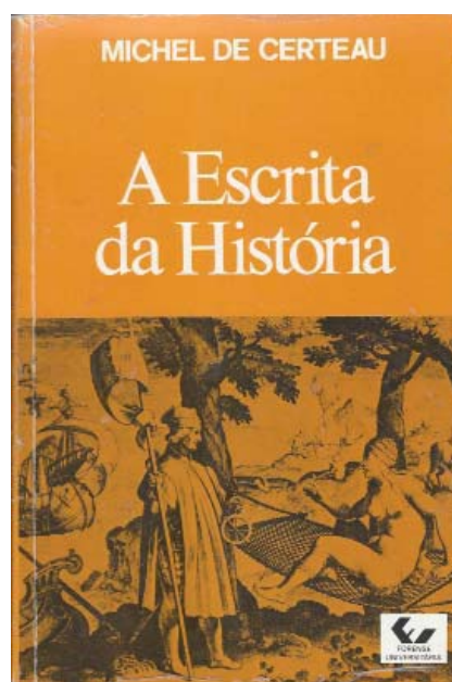
(Foto da capa do livro “ A escrita da História” de Michel de Certeau.

Mas o pesquisador precisa dar continuidade ao seu trabalho. Ele deve garimpar livros que tem em mãos e procurar citar outras obras mencionadas por diversos pesquisadores. Por isto a necessidade de verificar os textos que falam sobre a história de Historiografia. Debruçar-se sobre trabalhos de arrolamento de obras e de autores é um dos primeiros passos importantes para melhor apontar discussões sobre essa produção e o “lugar” da mesma.