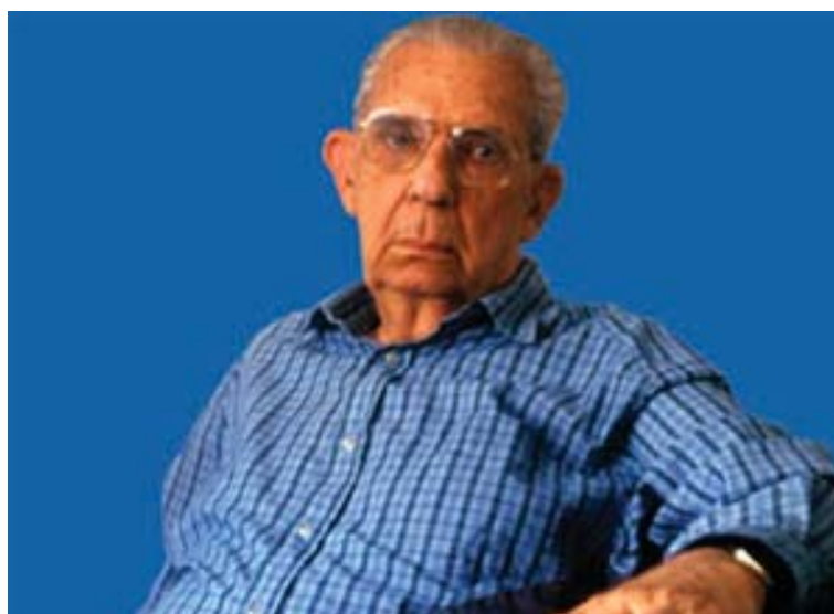
(Foto de José Calasans. Fonte: http://bahiatododia.com.br/index.php?artigo=4411 , 23 de abril de 2013).

E a comunidade dos historiadores sergipanos recepciona esse texto da história da História Sergipana? Qual o lugar institucional que “fala” Silva quando produz esse seu texto e o torna público pela primeira vez no V Simpósio de História do Nordeste, em 1973? Como ele “operacionaliza” essa sua escrita historiográfica? De que forma constroi as representações da Historiografia sergipana?