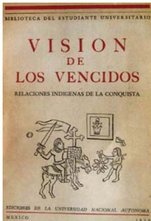
“Tapa de una edición de Visión de los vencidos ”. Disponible en: http://nativos-uamitosxochimilcas.blogspot.com.br . Accedido el: 03/06/2016.