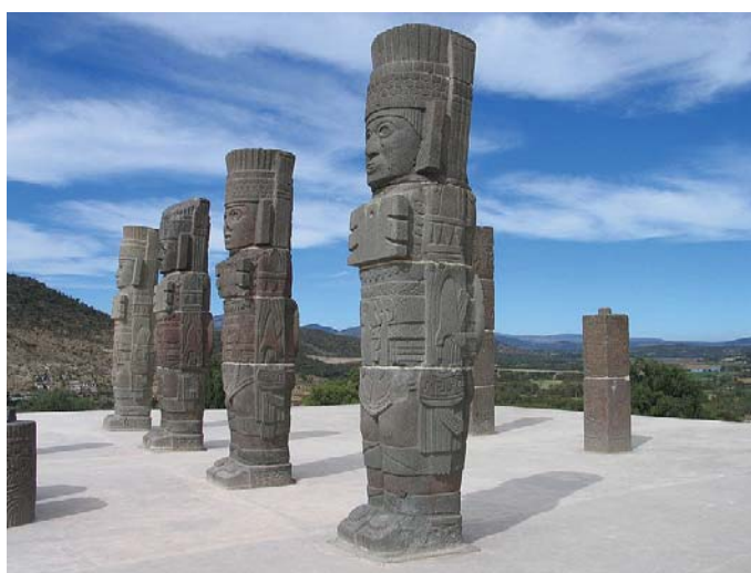
“Guerreros toltecas representados en las famosas estatuas de Tula llamadas atlantes”. Disponible en: https://es.wikipedia.org . Accedido el: 05/06/2016.

Después de fijarse en su cosmogonía, se presenta en el libro la historia de los grupos quichés: “su origen, sus migraciones; la fundación de sus ciudades; sus relaciones, tanto de paz, como de guerra, con los otros grupos de Guatemala, y los hechos de sus reyes” (DE LA GARZA, 1980, p. XVI). Hay, además, en ese mismo fragmento relatos que nos acercan a su organización política, social y religiosa, a partir de la perspectiva de sus rituales y los conceptos sobre sus dioses y su posición ante el sentido de la vida humana. Por fin, hablan también respecto a los demás pueblos que estuvieron en Guatemala durante el periodo Posclásico (900-1500 d.C.), y asimismo sobre la marcada influencia de los toltecas (pueblo nahua que dominó el norte del altiplano mexicano entre los siglos X y XII) en el todo maya (Cf. DE LA GARZA, 1980).