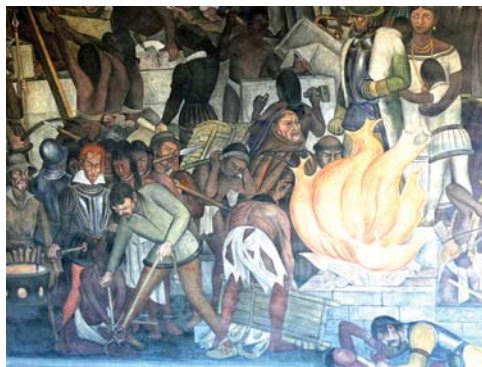
“Quema de la Literatura Maya, mural de Diego Rivera”. Disponible en: https://commons.wikimedia.org . Accedido el: 05/06/2016.

Lo de arriba se recoge aun de relatos de algunos de los hombres de fe de la corona española, tal como lo hizo el fray Diego de Landa, responsable de una Relación relevante acerca de la cultura maya, pero que al mismo paso lideró lamentables acciones inquisitorias en contra los mismos mayas. Sobre uno de esos sucesos de inquisición y censura, el “Auto de fe de Maní”, escribe él: “Hallámosles [sic] gran número de libros de estas sus letras, y porque no tenían cosa en que no hubiese supersticiones y falsedades del demonio, se los quemamos todos, lo cual sintieron a maravilla y les dio mucha pena.” (LANDA, [¿1566?] 1966, p. 105)