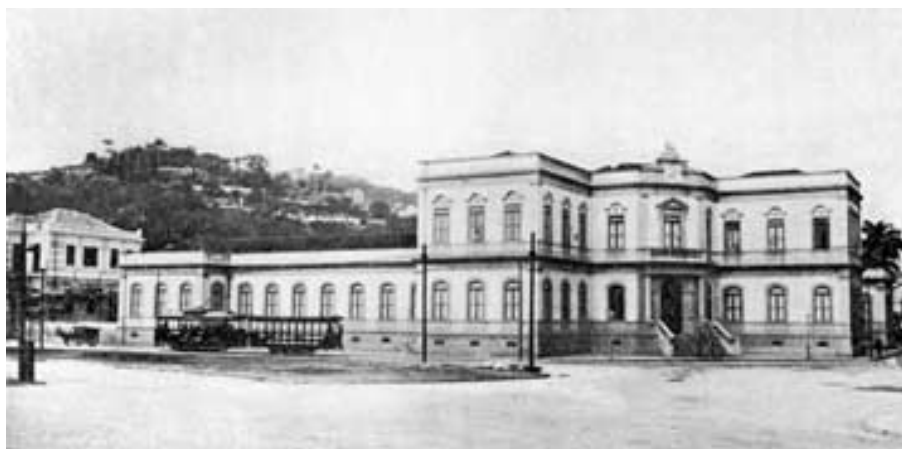
Silogeu Brasileiro na Lapa- Rio de Janeiro, sede do IHGB por várias décadas.

Em relação à presença da disciplina escolar História no ensino secundário brasileiro, enfatizamos que ela esteve estritamente ligada a duas instituições, quais sejam, o Colégio Pedro II e o Instituto Histórico e Geográfico Brasileiro (IHGB).