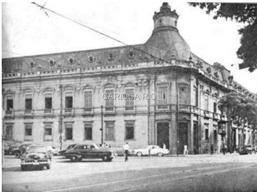
Colégio Pedro II (1940)