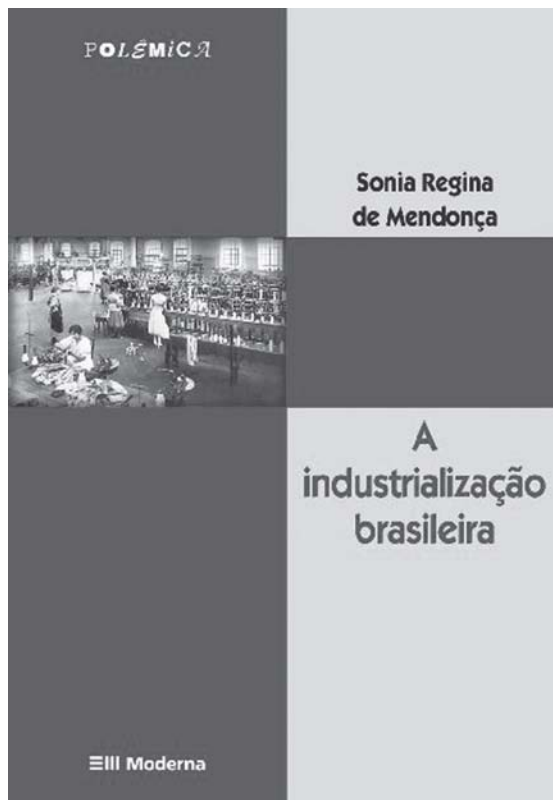
Capa do livro “A industrialização no Brasil”.

Nesta 9ª aula vamos estudar como ocorreu o início do processo de industrialização no Brasil. Para isto, analisaremos o processo de crescimento urbano pelo qual passou o Brasil a partir do final do século XIX. Como estudamos nas aulas anteriores, o Brasil, como as demais regiões mundiais, foram, historicamente, recebendo as influências e determinações do capitalismo internacional. Durante o processo pelo qual o Brasil estava organizando o seu território, entre o séculos XVI e XIX, o modo de produção capitalista estava sofrendo alterações em suas relações de produção. Essas alterações ocorreram com a passagem da fase do capitalismo comercial para a fase industrial. As transformações ocorridas, inicialmente na Europa e depois na América do Norte, mediante as mudanças do capitalismo internacional, reforçado pelas transformações que influenciadas pela Revolução Francesa e pela Revolução industrial, interferiram de maneira direta nos rumos da economia brasileira. A economia brasileira, que desde a formação de seu território foi dependente, vem sendo desenvolvida, recebendo influência das nações hegemônicas européias. Assim, vamos estudar o processo pelo qual passou o Brasil para a formação de seu parque industrial e a as conseqüências desses fatos na sua população e no processo de urbanização.