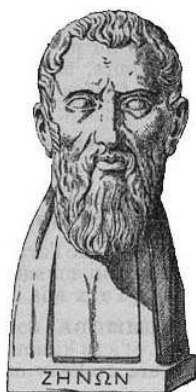
Zenão de Eléia

Essas crises se repetem ao longo da história e cada superação representa um avanço monumental. O surgimento do Cálculo, no século 17, e a compreensão das teorias desenvolvidas por Cantor, no início do século 20, são exemplos disso.