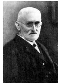
Richard Dedekind (1831 - 1916)

Com a onda de rigor que percorria a Matemática, fortemente influenciada pelas contribuições de Gauss, uma questão que mais uma vez se apresentava era a necessidade de estabelecer uma correspondência definitiva entre os números e a reta, estabelecendo em definitivo o que chamamos de conjunto dos números reais – um desafio quase tão velho quanto a Matemática. Os números racionais são mais fáceis de estabelecer, a partir dos números inteiros, e bastam para o nosso dia-a-dia. No entanto, como a questão da não-racionalidade de \sqrt{2} mostrou, eles não são suficientes para medir tudo.