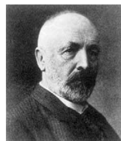
Georg Cantor nasceu em 3 de março de 1845, em São Petersburgo, filho de um casal de amantes da arte e da cultura. Cantor sabia tocar violino e, além da Matemática, tinha um grande interesse por filosofia e por literatura. Formou-se na Universidade de Berlim e passou sua vida como professor na Universidade de Halle.

Kronecker era um homem rico, um grande matemático, e chegara a uma posição de destaque na Universidade de Berlim por seus próprios méritos. Por que,