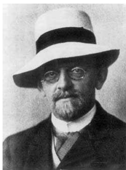
David Hilbert (1862 - 1943)

Além disso, iniciara uma corrente de pensamento matemático chamada for-