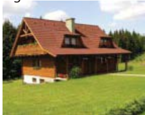
Una casa en la montaña.