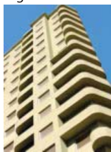
Un apartamento en el centro.