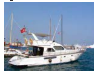
En un barco.