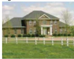
Una casa de campo.