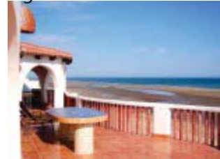
Una casa en la playa.