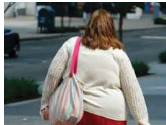
Casa en Isla Negra