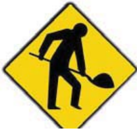
La Chascona en Santiago