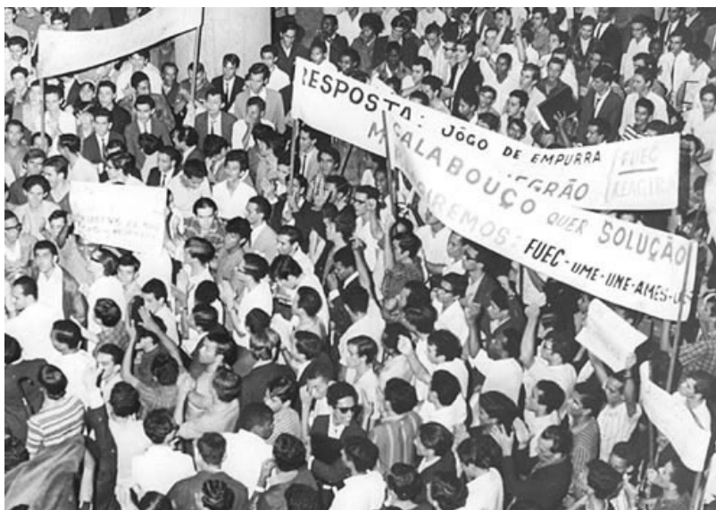
Movimento estudantil de 1968 na USP. Passeata dos 100 mil.

Conhecimento sobre o regime militar no Brasil em livros de sua escolha, especialmente, sobre o AI-05.