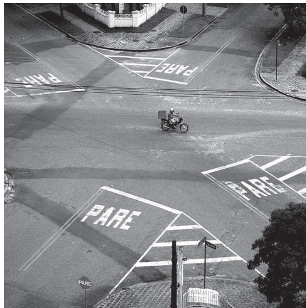
Incerteza (Fonte: http://images.google.com.br ).

É importante saber que essas incertezas nos valores experimentais sempre existem e devem ser levadas em conta toda vez que forem comparadas com um valor teórico. Veja esse exemplo: O valor p é obtido ao dividirmos o comprimento de uma circunferência pelo seu diâmetro. O valor teórico com dez dígitos é 3,141592654.