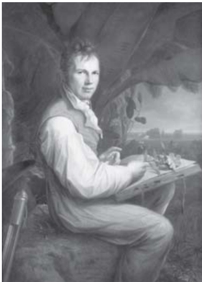
Figura 4. Alexandre Von Humboldt, pesquisador alemão que fez importantes contribuições na biogeografia do mundo.

Os estudos de Fitogeografia em nosso país iniciam-se com as observações de viajantes europeus que, cruzando o Brasil deixaram numerosos trabalhos. No início do século XVIII destacaram-se Humboldt (figura 4), que infelizmente percorreu apenas pequena parte da Amazônia.