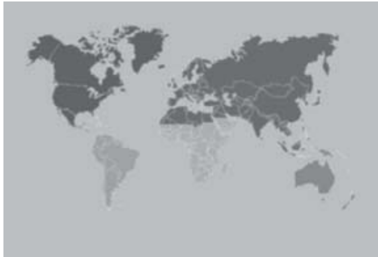
Figura 3. As grandes regiões biogeográficas do mundo.

(bio = vida + topo = lugar, ou seja, lugar onde se encontra vida) é uma região que apresenta uniformidade de ambiente e de populações animais e vegetais, das quais é o hábitat.