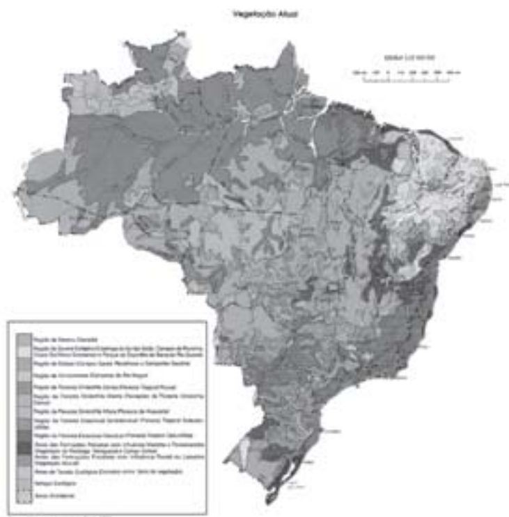
Matapa da vegetação.

nesta aula situaremos a posição epistemológica e a natureza metodológica do estudo da Biogeografia no contexto da Geografia. Comentaremos sobre as diferentes perspectivas ecológicas e históricas, assim como os principais objetos de estudo. Finalmente analisaremos uma perspectiva dos estudos biogeográficos no Brasil.