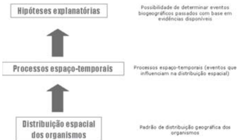
Figura 2. Esquema da Biogeografia Histórica.

Na figura 2 poderemos observar como funciona cientificamente a Biogeografia Histórica.