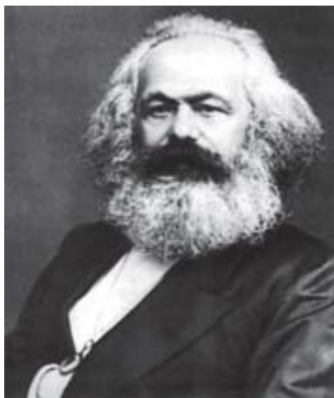
Figura 2. Karl Marx intelectual e revolucionário alemão, fundador da doutrina comunista.

Para Karl Marx (século XIX, figura 2), é preciso buscar a unidade entre natureza e história, ou entre natureza e sociedade, pois a natureza não pode ser concebida como algo exterior a sociedade, visto que esta relação é um produto histórico.