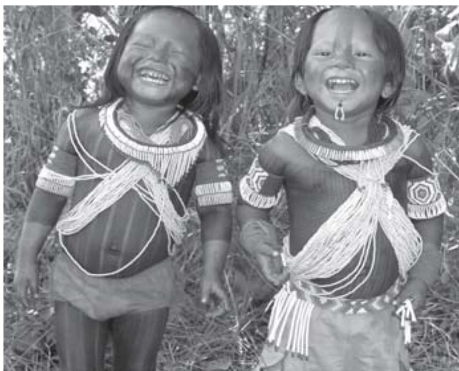
Relação homem e natureza.

entender o conceito de segunda natureza.