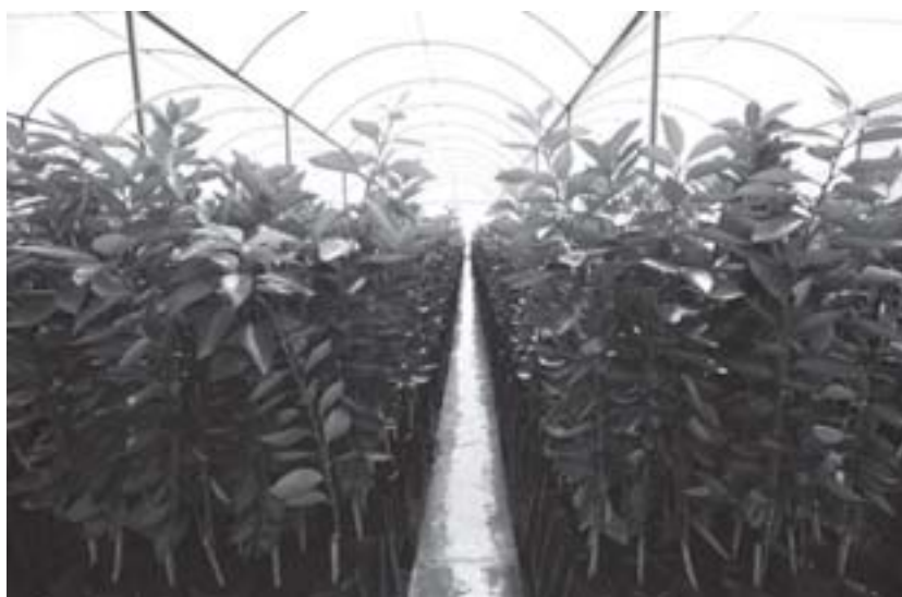
Figura 4. Viveiro de produção de mudas de citrus aumenta a produtividade e mudam as antigas relações de produção.

Para Casseti (1991), as transformações sofridas pela natureza, através do emprego das técnicas no processo produtivo (figura 4), são um fenômeno social, representado pelo trabalho, e as relações de produção mudam conforme as leis, as quais implicam a formação econômico-social e, por conseguinte, as relações entre a sociedade e a natureza.