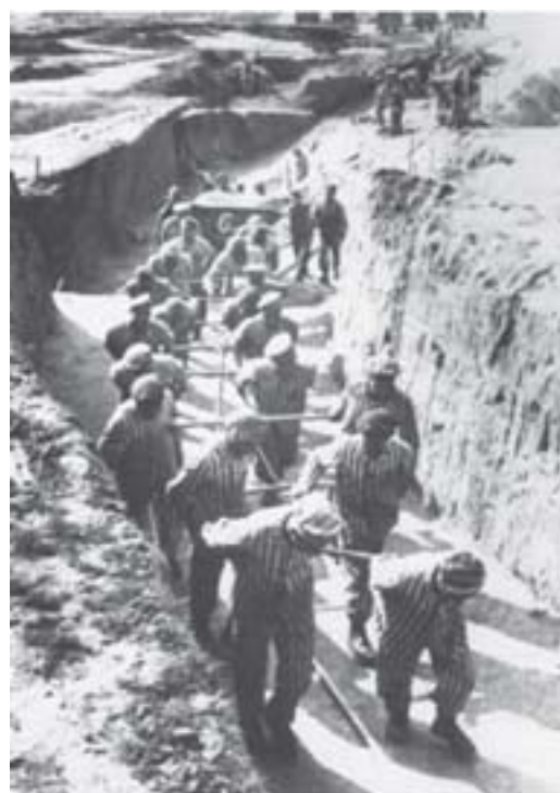
Figura 5. Trabalho forçados algumas vezes escravos, países como Brasil, Colômbia e China, continuam utilizando a mão de obra escrava nas minas de carvão.

Segundo Pato (1996, p. 15) a verdadeira natureza do trabalho alienado se explicita quando a) o trabalhador se sente contrafeito, na medida em que o trabalho não é voluntário mas lhe é imposto, é trabalho forçado figura 5 ; b) o trabalho não é a satisfação de uma necessidade mas apenas um meio para satisfazer outras necessidades; c) o trabalho não é para si, mas para outrem; e d) o trabalhador não se pertence, mas pertence a outra pessoa.