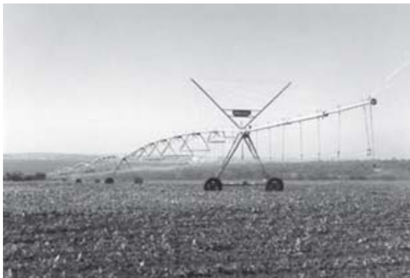
Figura 3. Os avanços nas tecnologias permitem que as técnicas de irrigação por gotejamento aumentem a produtividade de culturas de cana e laranja.

Com Platão e Aristóteles já havia um certo privilegiamento do homem e das idéias e um certo desprezo por determinados elementos que se convencionou denominá-los como parte da natureza física (pedras, plantas etc). O pensamento mítico dos retóricos e sofistas pensadores cedeu lugar ao pensamento daqueles que passaram a compor a filosofia grega.